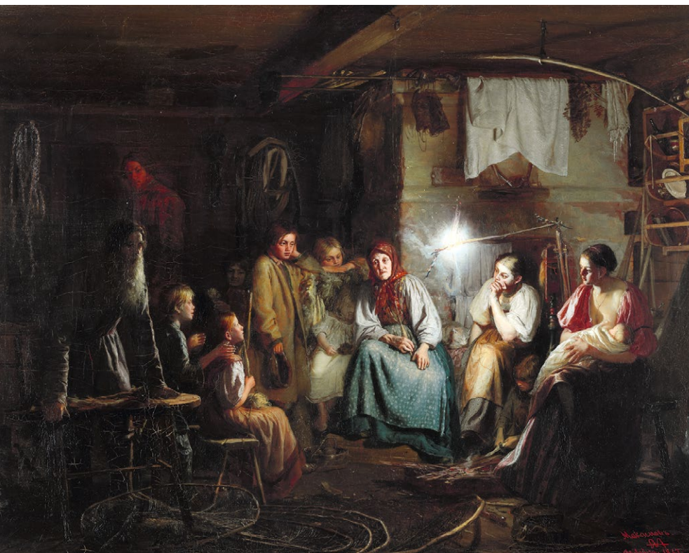
Бабушкины сказки. Картина Василия Максимова. 1867 г.

для обозначения нечистой силы нередко используют одни и те же слова: и в сказке, и в быличке есть чёрт, иногда — леший, Баба Яга часто зовется колдуньей или ведьмой. Однако при всем внешнем сходстве это два принципиально разных жанра. Во-первых, былички невелики по объему — волшебные сказки, как правило, значительно длиннее. Во-вторых, как уже говорилось, события быличек в целом воспринимаются как вполне правдивые, случились они недавно и в знакомых рассказчику и слушателям местах — в то время как события