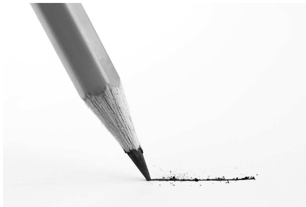
Линия, проводимая острием хорошо заточенного мягкого карандаша

Например, разнообразные линии можно провести простым карандашом. Рисуя острием только что заточенного карандаша, вы получите четкую, тонкую, яркую линию. Если же карандаш уже