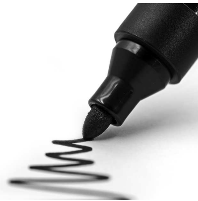
Простой маркер и проведенная им линия

Линерами и остро заточенными карандашами удобно прорабатывать мелкие детали рисунка, делать различные декоративные дополнения (если Вы работаете в смешанной технике – разными материалами и инструментами).