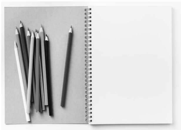
Простые карандаши и скетчбук «на пружинке»

В нашем издании мы приведем лишь несколько примеров материалов и средств для рисования, а дальше вы будете уже экспериментировать самостоятельно.