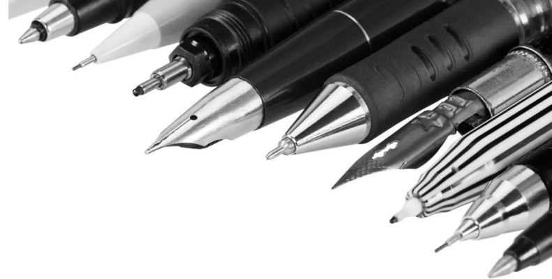
Механические карандаши и перьевые ручки

Для упражнений в каллиграфии часто используют перьевую ручку и чернила; линии, которые можно провести с их помощью, очень красивы и часто применяются в лetterинге. Перьевые ручки различаются по ширине пера; чем она больше, тем толще проведенная ручкой линия. Сейчас в продаже есть современные перьевые ручки, но некоторые любители работают с такими, какие были в ходу сто лет назад. Это тоже может быть интересно.