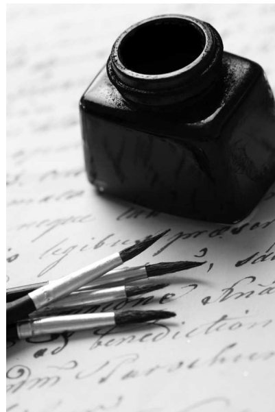
Кисти и тушь для каллиграфии

Маркеры. Они в большинстве своем дают довольно толстую линию, но у некоторых маркеров есть тонкий кончик, позволяющий прорабатывать довольно тонкие и мелкие детали рисунка. Маркеры неплохо подходят для изготовления ярких, не слишком сложных надписей.