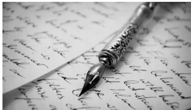
Старинная перьевая ручка и сделанные ею надписи