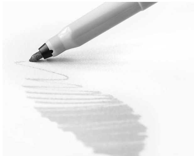
Разные варианты линии, проведенной маркером или фломастером

Маркер со скошенным острием или с заостренным кончиком может дать тонкую линию, одинаково плотную по всей своей протяженности, если рисовать самым кончиком. Если же держать маркер наискосок к поверхности бумаги, чтобы линия проводилась не острием, а скошенной частью, то линия будет толстая, но при этом, скорее всего, не очень равномерная по плотности: на ее протяжении будут как более темные, так и более светлые участки. Равномерной она получится, если маркер совсем новый.