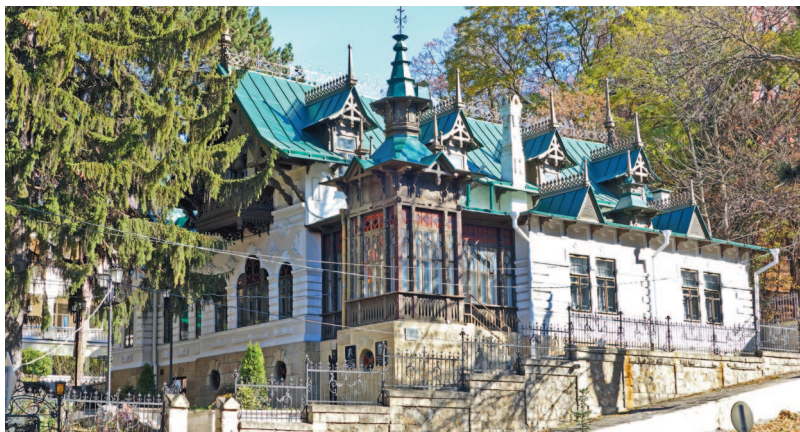
■ Музей «Дача Шаляпина»

3 Обойти музеи Кисловодска. Отличный способ с пользой провести время и познакомиться с историей города, если погода не располагает к долгим прогулкам.