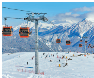
■ Горнолыжный курорт в Архызе