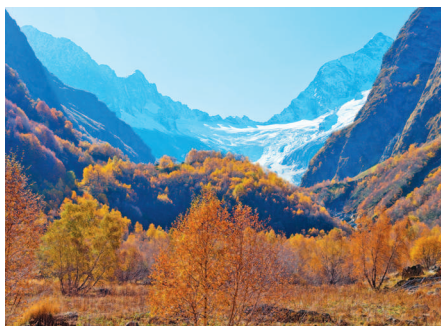
■ Ледник Птыш в Домбае

Хорошая идея совместить поездку на Кавказ в межсезонье с посещением национальных музеев и галерей, познакомиться с местной культурой и творчеством.