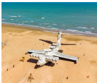
■ Экраноплан «Лунь» в Дагестане