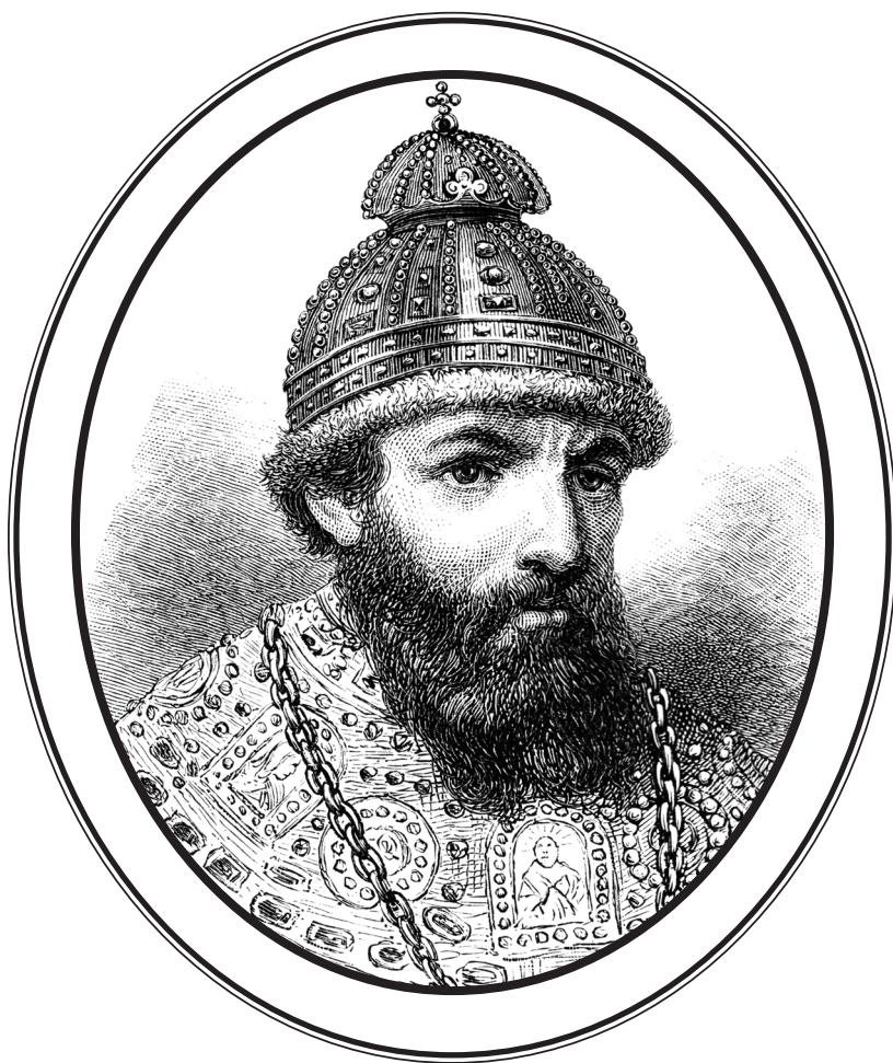
ИОАНН ІV ВАСИЛЬЕВИЧ (1530—1584)