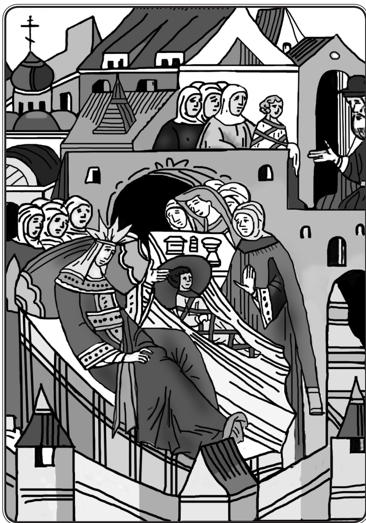
Рождение Ивана Грозного.

Традиция крепла, а в XV веке торжествовала уже. Иван Калита, его личность и политика — прототип московских князей вплоть до самого Грозного. Ничего великого, выдающегося, ничего блестящего. Природа поскупилась на краски, создавая этого князя-хозяина и князя-помещика, скупого, медленного, хитрого, неуклонно стремящегося к поставленной цели. О невозможном он не мечтал, как не мечтал о геройских подвигах и славе. Каждая копейка у него на счету. Что приобретено им, приобретено навеки. Как настоящий практик, человек маленькой действительности, он пользуется всякой ошибкой ближнего, идет на унижения, когда это нужно, неумолим и непреклонен, раз сила на его стороне. Его борьба с тверским князем не только не говорит нам о благородстве его души, а прямо наоборот. Зато дипломатической тонкости сколько угодно. Бедный Александр и не заметил, как ловко расставили вокруг него сети и как неожиданно и безысходно попался он в них.