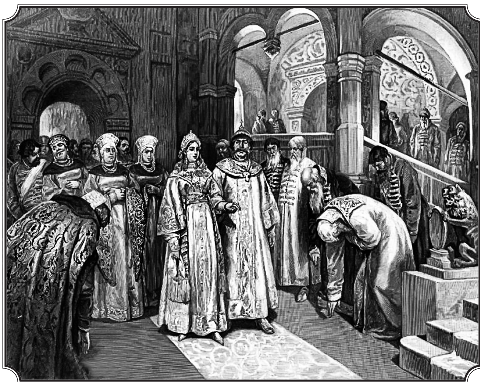
Клавдий Лебедев. Василий III, великий князь Московский, вводит во дворец невесту свою, Елену Глинскую.

Грозному было несколько месяцев, когда умер его отец, и с небольшим три года, когда умерла или была отравлена его мать — Елена Глинская, супруга Василия III. Ребенок остался без надзора и руководства. Все делалось