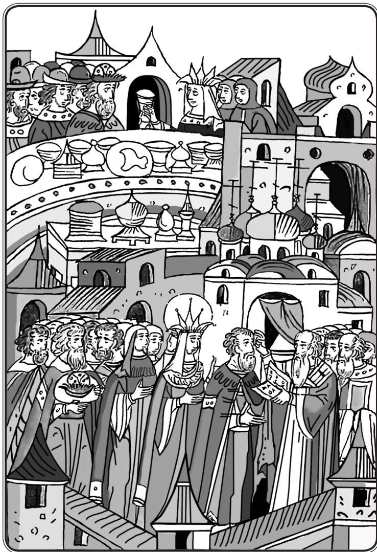
Венчание Василия III Иоанновича и Елены Глинской. Миниатюра из Лицевого летописного свода. XVI в.

Московская Русь сложилась и оформилась уже в княжение Ивана III. Сын его Василий мало прибавил к делу отца и, уничтожив вольность Пскова, он лишь завершил давно начатую и в главном законченную уже борьбу с вольностью вообще. Иван III и Василий — уже государи в полном значении этого слова, самодержцы. Эпоха их правления создала и как нельзя яснее сформулировала устои Московской Руси.