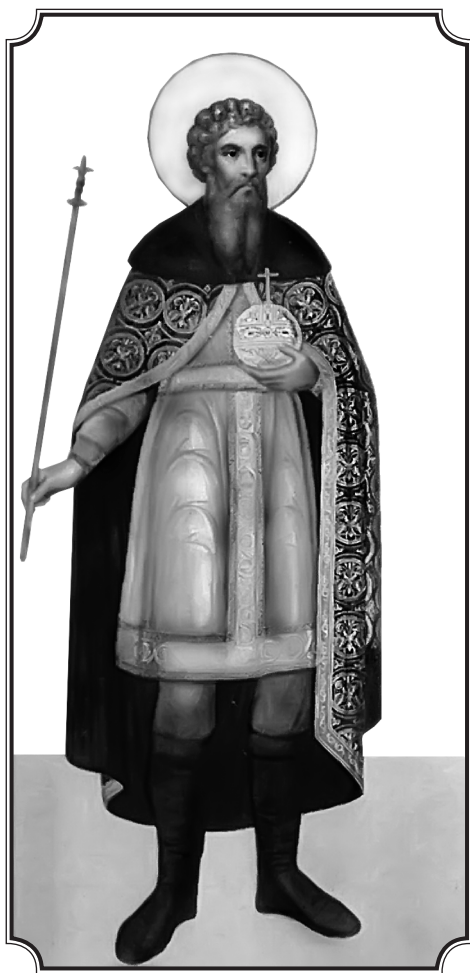
Иван Калита (1283—1340).

Все приведенные факты приобретут в наших глазах особенную ценность, если мы припомним, как медленно и постепенно входили они в жизнь. Принципы дома Калиты не поражают нас ни глубиной, ни широтой своего размаха, а скорее даже узостью. Но в конце концов они восторжествовали над всеми остальными. Случайности истории много виноваты в этом, но еще больше виновата та настойчивость и упорство, с какой князья пользовались всяким удобным случаем, чтобы расширить свою власть и пределы.