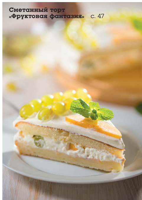
Сметанный торт «Фруктовая фантазия» с. 47