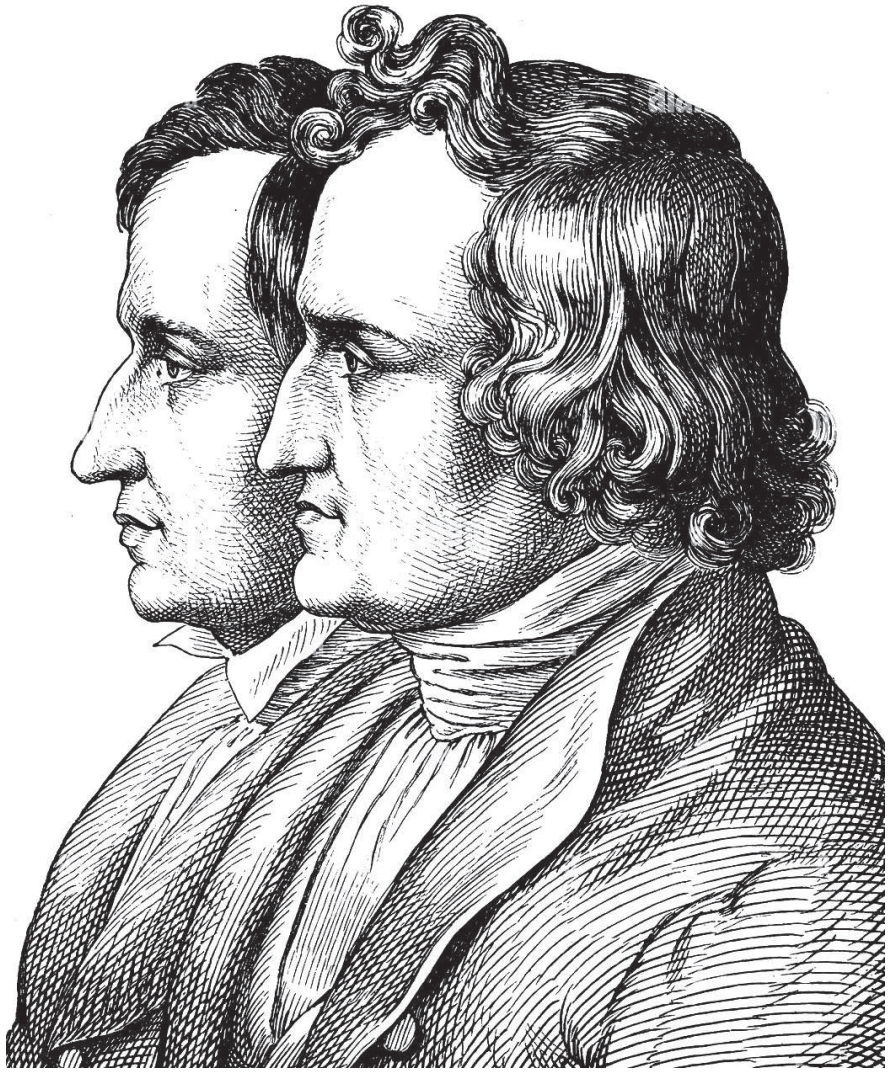
БРАТЯ ВИЛЬГЕЛЬМ И ЯКОБ ГРИММ