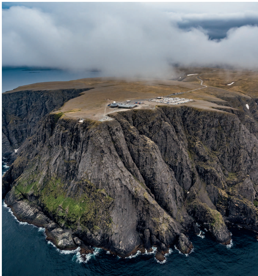
↑ Мыс Нордкап

Разнообразные фигурки троллей и викингов, модели кораблей-драккаров. Для знатоков эзотерики — всевозможные амулеты из области древнескандинавской мифологии и религии. Из деликатесов — твердый сыр, шоколад, вяленое мясо (в том числе китовое). Для любителей пропустить стопочку-другую — местное пиво или картофельную водку «Аквавит». Самым отчаянным — раффиск, или квашеную рыбу. Вкусно, но очень, очень сильно пахнет. Так что провезти это в багаже или ручной клади проблематично. И потом, употреблять это блюдо рекомендуется только людям с хорошим иммунитетом.