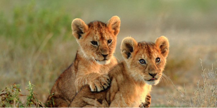
↑ ЮАР. Львята в Парке Крюгера