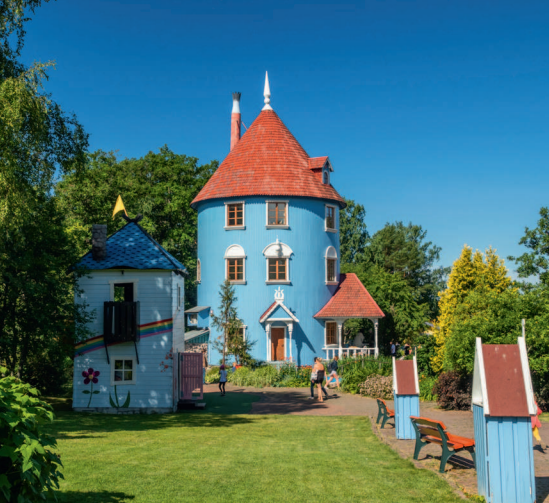
↑ Муми-дом и окрестности