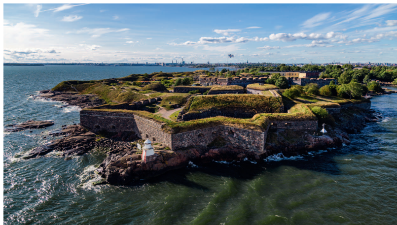
↑ Свеаборг-Суоменлинна с высоты птичьего полета

Хотите не только подышать свежим балтийским воздухом, но и проникнуться историей? Отправляйтесь в крепость Суоменлинна, или Свеаборг. Первый вариант названия — финский, второй — шведский. Эти мощные укрепления на островах, известных как Волчы шхеры, были построены в XVIII столетии, во времена, когда финские земли входили в состав Швеции. Они прикрывали с моря город Хельсинки, который именовался тогда Гельсингфорсом. Сейчас крепость внесена в список Всемирного наследия ЮНЕСКО, на ее территории работает несколько музеев: например, Военный музей, посвященный истории войн XX столетия, а также настоящая подводная лодка «Весикко».