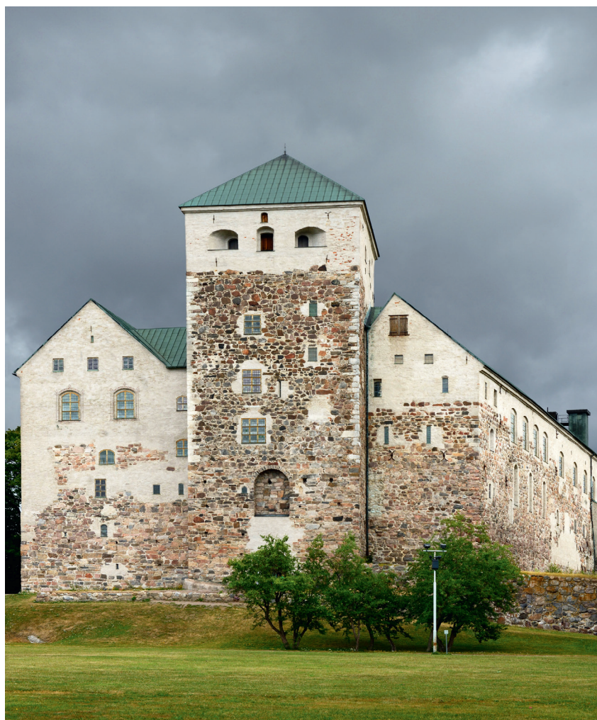
↑ Укрепления Абоского замка

История этого замка началась в XIII веке, когда шведские правители, осваиваясь на захваченных землях, стали возводить на них разнообразные укрепления для защиты новых рубежей. В их числе, например, Абоский замок, Олафсборг, Расеборг и Выборгский замок, который позже оказался на территории России. Название «Абоский» появилось благодаря старому имени города Турку — Або. В первые века своего существования замок использовался по своему прямому назначению, несколько раз перестраивался и расширялся. Когда он прекратил функционировать как военный объект, там располагалась тюрьма. Сейчас Абоский замок является городским музеем и местом проведения разнообразных мероприятий — от исторических реконструкций до свадеб.