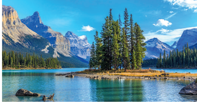
↑ Канада. Национальный парк Банф