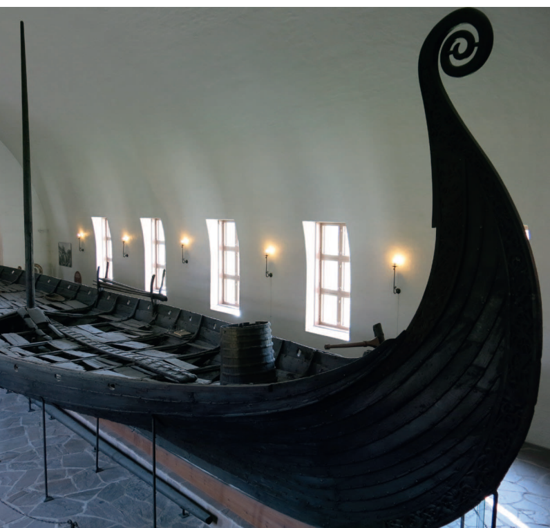
↑ Осебергская ладья в Музее кораблей викингов в Осло

В Осло на полуострове Бюгдё находится музей, в котором любители истории викингов забывают о времени. Здесь можно полюбоваться кораблями, которые некогда обнаружили археологи. Так, например, в этом музее находится Тюнский драккар X века, на котором был погребен какой-то знатный воин, Осебергская ладья IX столетия, Гокстадский корабль длиной более двадцати метров и многие другие замечательные вещи. И, конечно же, вам обязательно расскажут о том, что Америка была открыта вовсе не Колумбом: первыми европейцами на этом континенте были средневековые викинги. Эта версия давно подтверждена историками.