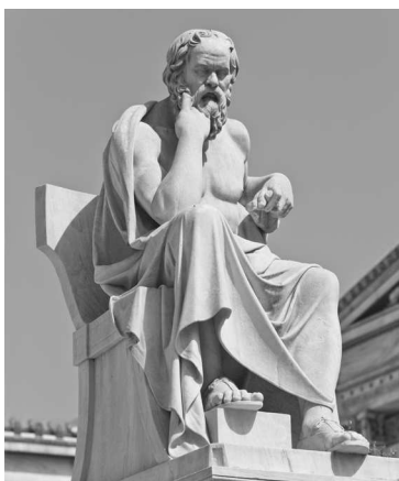
Памятник Сократу возле Академии наук в Афинах. Л. Дросис. Вторая половина XIX века

Сократ (ок. 469 года до нашей эры — ок. 399 года до нашей эры) — знаковая для мировой философии фигура; благодаря ему в истории философской мысли принято выделять «досократический» («досократовский») и «сократический» периоды. Если до него философы рассматривали в основном вопросы мироздания — происхождение Вселенной, суть «первоначала», свойства предметов и материи, — то Сократ поставил в центр своих исследований человека. Имя этого античного философа давно стало символом стремления к истине, самопознанию, непримиримого отношения к несправедливости и воинствующему невежеству.