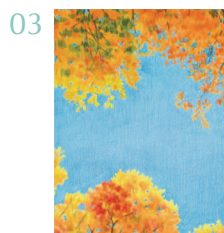
Прогулка под осенним небом 77