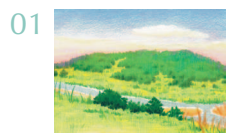
Одинокая вершина на Чеджу 73