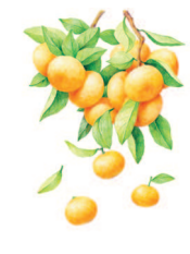
Мандарины на дереве 44