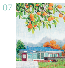
Мамина хурма 68