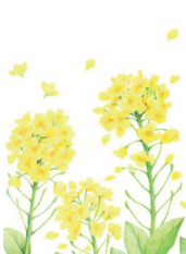
Цветы рапса 42