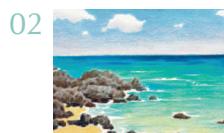
Лазурное море на Чеджу 75