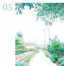
Деревня Коджи 64