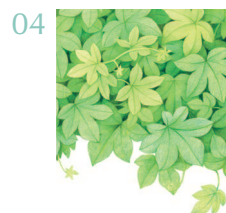
Японский хмель 62