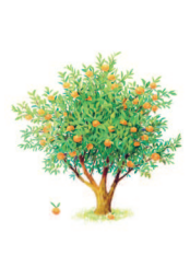
Мандариновое дерево 48