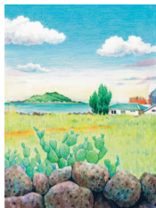
Побережье Хёпчже 46