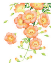
Летний камписис 26