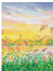
Утро на реке Хан 20