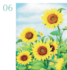
Поле подсолнухов 66