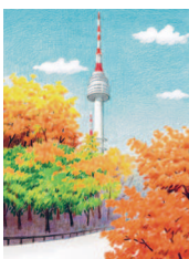
Дорога, огибаю- щая Намсан 32