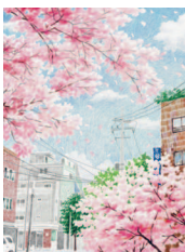
Вишнёвые деревья 24