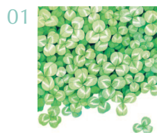
Поиск счастья 56