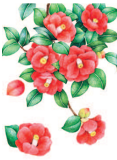
Цветы камелии 50