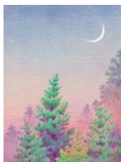
Рассвет в кедровом лесу 38