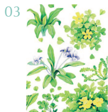
Разные растения 60