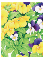
Фиалки в цветнике 28