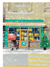
Улица Маннидан-киль 34