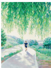
Утро, река Хан, благодарность 22