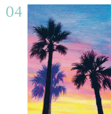
Пальмы на Чеджу 79