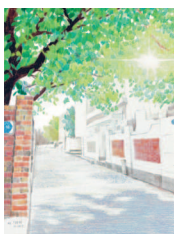
Переулок в летний день 30