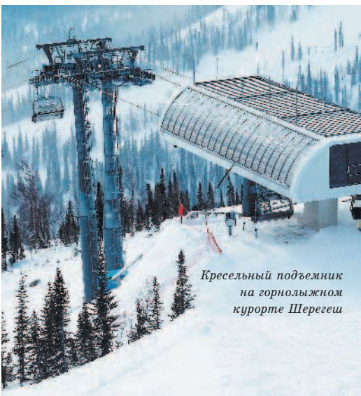
Кресельный подъемник на горнолыжном курорте Шерегев

Это разновидность гондольного подъемника, только кабины здесь жестко прикреплены к тросу и их всего две. Они двигаются навстречу друг другу. Такие канатные дороги используют на сложных рельефах местности. Чтобы обеспечить хорошую пропускную способность, кабины на маятниковой дороге могут вмещать до 100 человек и более.