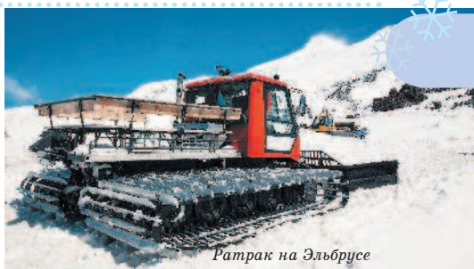
Ратрак на Эльбурсе

Чемпионат мира по сноубордингу по версии ФИС проводится раз в 2 года, а многоэтапный Кубок мира – ежегодно. Сноубординг входит в программу Зимних Экстремальных игр (X-Games),