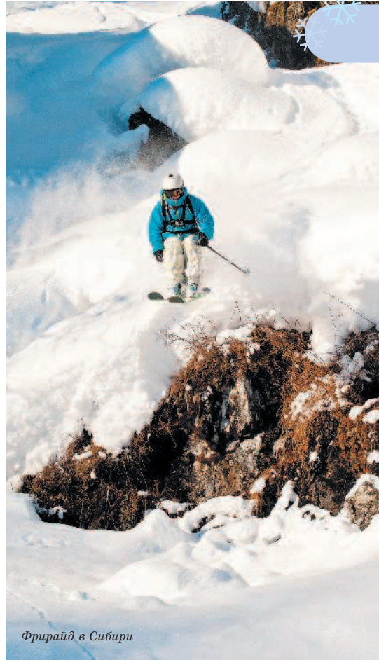
Фрирайд в Сибири

На всех горнолыжных курортах обязательно наличие специальных служб