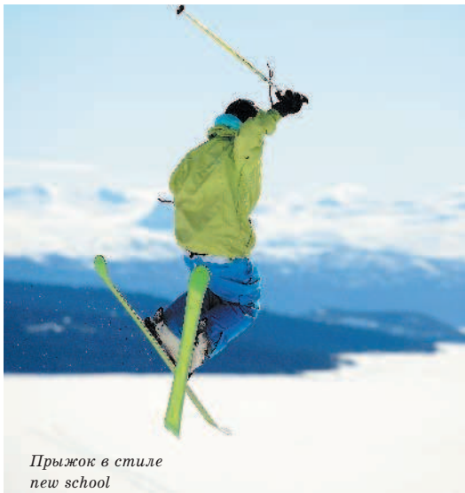
Прыжок в стиле new school

«Черным» цветом обозначаются трассы самого высокого уровня сложности (уклон свыше 40 % при ширине 35–40 м). Ее рельеф наиболее разнообразен с легким, средним и большими углами наклона. Крутизна отдельных участков может достигать 60 %. Также допустимы резкие боковые наклоны.