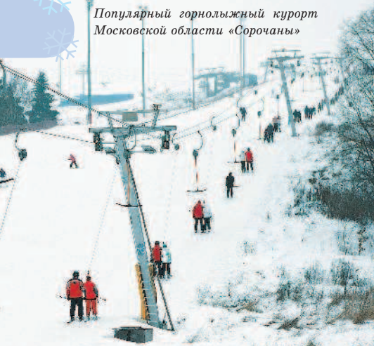
Популярный горнолыжный курорт Московской области «Сорочаны»

с хафпайпом, трамплинами, воздушной подушкой, рейлами и другими сооружениями для сноубординга.