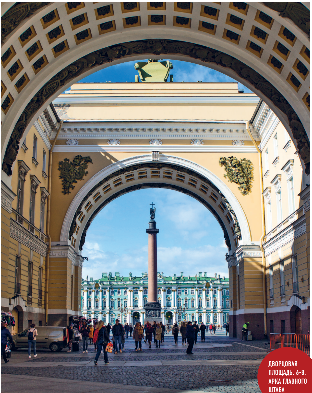
ДВОРЦОВАЯ ПЛОЩАДЬ, 6-8, АРКА ГЛАВНОГО ШТАБА