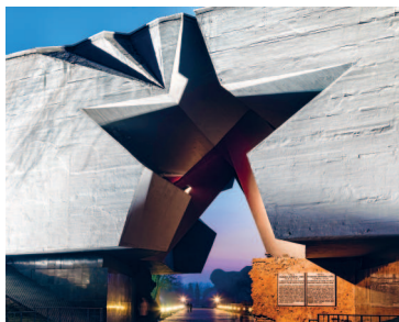
Главный вход на территорию Брестской крепости.

В Брест-Литовске с 22 декабря 1917 г. по 3 марта 1918 г. происходили мирные переговоры между Советской Россией и Германией, по итогам которых 3 марта 1918 г. в Белом дворце