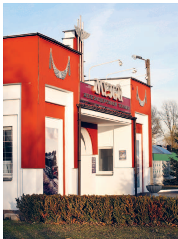
Музей железнодорожной техники.

26 апреля 1842 г. состоялось торжественное открытие новой крепости, которая располагалась на четырех островах. Центральное укрепление — Цитадель — было опоясано сплошной двухэтажной оборонительной казармой длиной почти в 2 км. В крепости было четверо ворот,