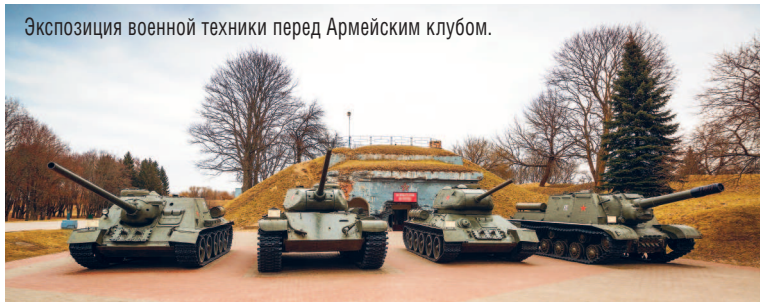
Экспозиция военной техники перед Армейским клубом.

По левую сторону находятся фундамент Свято-Никольской церкви и здание Кольцевой казармы (юго-восточная казарма Цитадели). В ней размещена экспозиция «Музей войны — территория мира», которая была открыта 22 июня 2014 г. к 70-летию освобождения территории РБ от немецко-фашистских захватчиков. Экспозиция является дополнением существующего