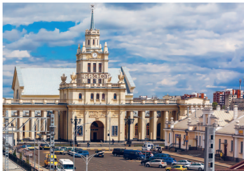
Железнодорожный вокзал Бреста.

За свою долгую историю город носил названия: Берестье, Берес-