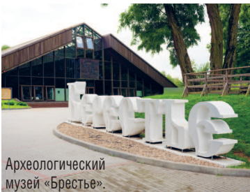
Археологический музей «Брестье».

Напротив Тереспольских ворот находился мост через реку За-