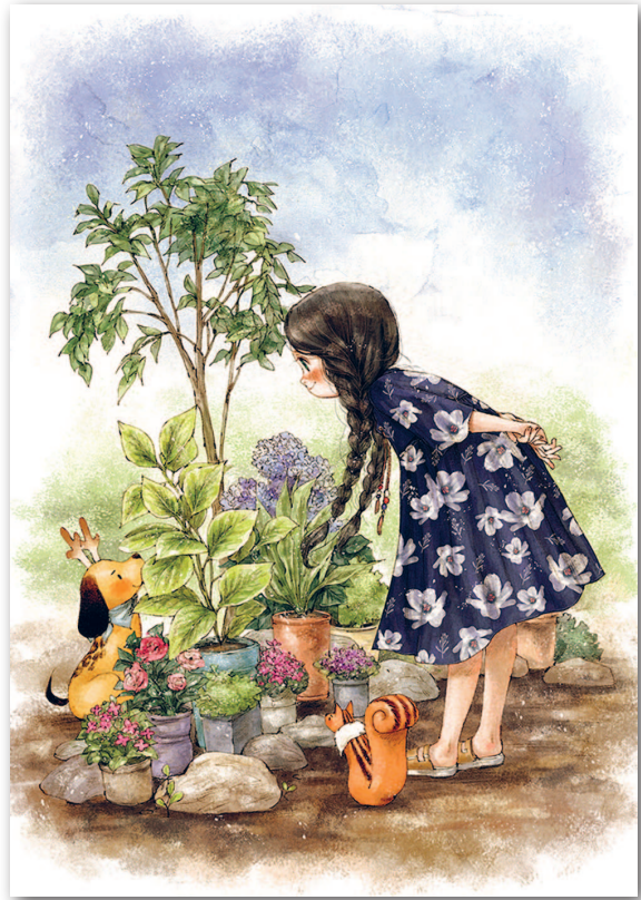
애빨, 《작은 여름 정원》, 2016. Аерроl, «Маленький летний сад», 2016.