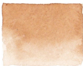
Yellow Ochre PY42/PY43