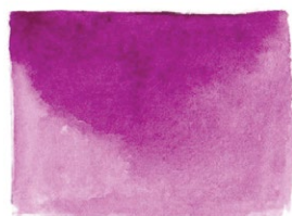
Red Violet PR81/PV3