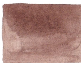
Burnt Umber PBR6/PY42