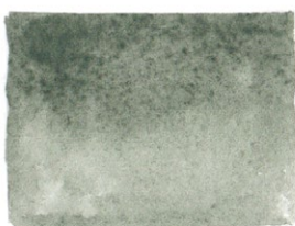
Davy's Grey PBk31/PG17/PW6