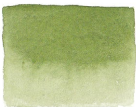
Sap Green PG7/PY1