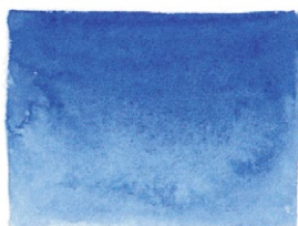
Ultramarine Light PB29