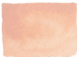
Jaune Brilliant PO13/PW6