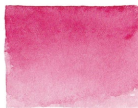
Rose Madder PR146