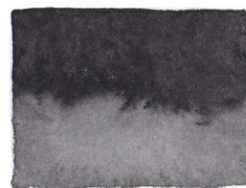
Ivory Black PBk6/PBk9