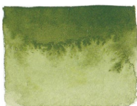
Olive Green PG8/PY1/PY2