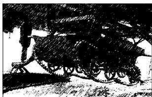
Подвеска танкетки под ДБ-3. 30-е гг. СССР

статочного количества боевой техники. Основное вооружение воздушно-десантных соединений и частей составляли преимущественно ручные и станковые пулеметы, 50-мм и 82-мм минометы, 45-мм противотанковые и 76-мм горные пушки, легкие танки (Т-40 и Т-38), огнеметы. Личный состав совер-