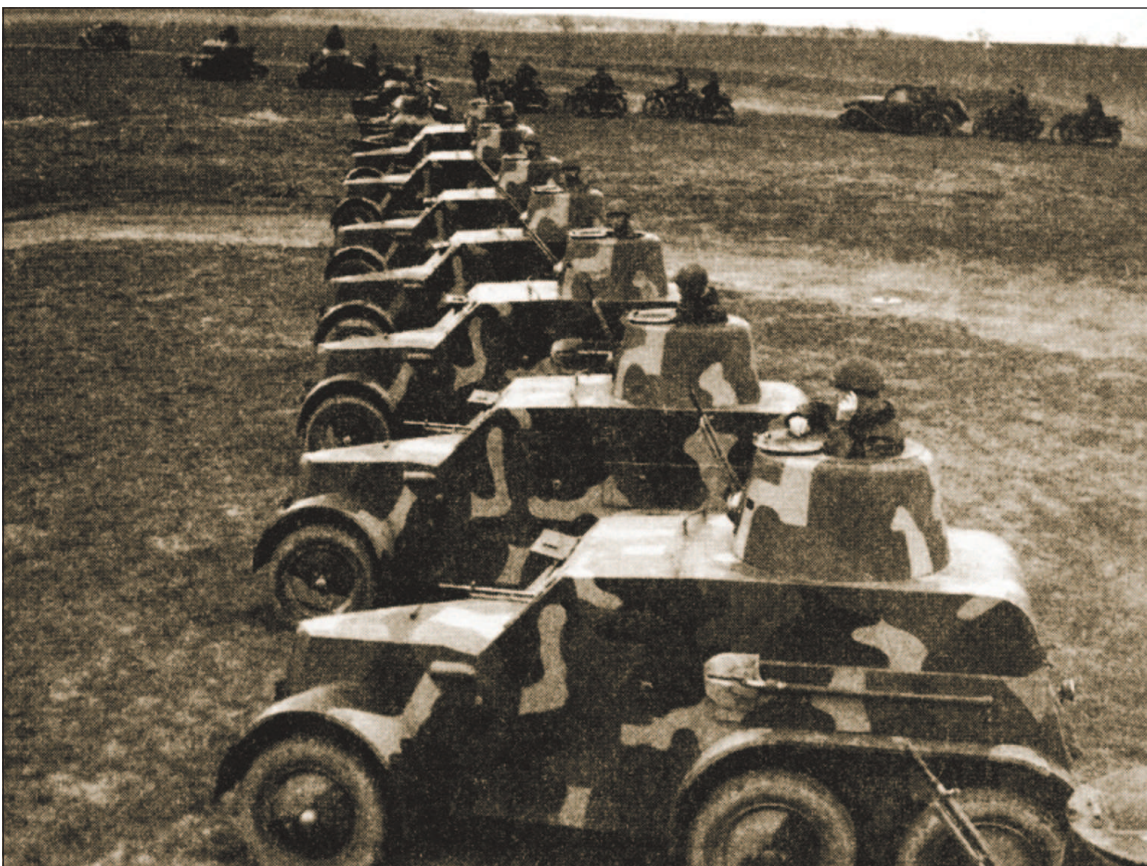
Чехословацкие бронемшины OA vz.30, которые после аннексии Судетской области и захвата Чехословакии начали поступать на вооружение вермахта.

В результате оккупации Чехословакии немцы получили доступ к чехословацкой военной технике, в том числе и к танкам. LT vz.38 был принят на вооружение немецкой армии под обозначением Pz.Kpfw.38(t) и в первые годы Второй мировой войны считался одним из лучших легких танков вермахта.