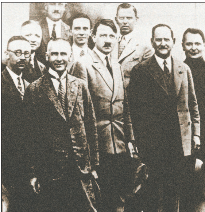
Руководство НСДАП в конце 1920-х гг. В центре А. Гитлер, который занимал пост председателя партии с 29 июля 1921 г. по 30 апреля 1945 г.

президенты, главы правительств, послы, министры и маршалы двадцати шести стран. В этот же день состоялось подписание Версальского мирного договора с Германией, официально завершившего Первую мировую войну. Отдельными статьями договора существенно ограничивалась военная мощь Германии. В частности, Германии запрещалось иметь многие современные виды вооружения, например боевую авиацию и бронетехнику.