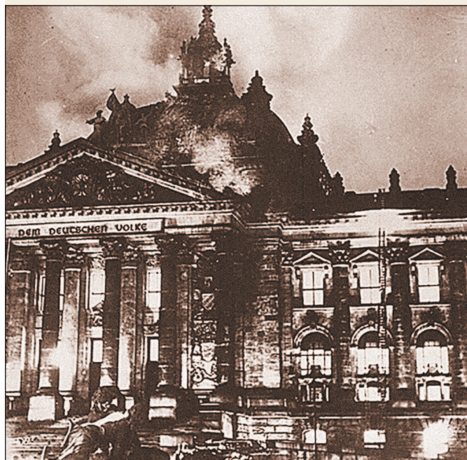
Горящее здание Рейхстага. 27 февраля 1933 г.

Нацисты объявили поджог Рейхстага результатом коммунистического заговора, направленного на срыв выборов, что позволило им начать массовые аресты коммунистов. В одном только Берлине в ночь на 28 февраля было арестовано 1500 человек, а по всей стране — более 10 тыс. коммунистов. Во время массовых арестов фашистам удалось 3 марта 1933 г. схватить Э. Тельмана, лишив компартию наиболее стойкого и целеустремленного руководителя. 28 февраля, на следующий после пожара день, Гитлер представил на подпись президенту Гинденбургу проект декрета «Об охране народа и государства», приостанавливавшего действие семи статей конституции, которые гарантировали свободу личности и права граждан.