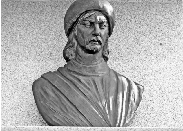
Бумын-каган. Бюст в городе Сёгут

сделать мне такое предложение?» — ответил Анагуй. Таким образом, «оскорбленный» Бумын-каган получил повод для восстания.