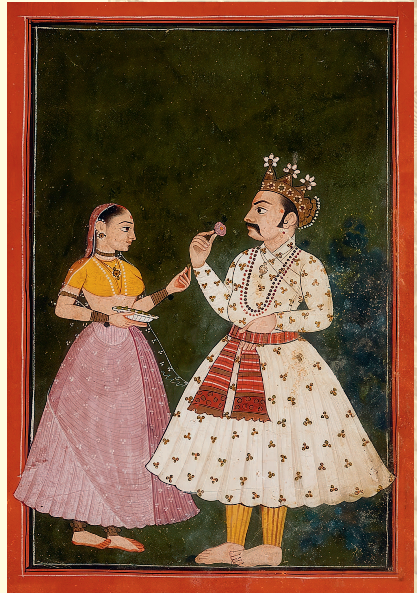
Царь Панду и его жена Кунти. XVII в.

Услыхали молодые воины о том, что Друпادا ищет для своей дочери жениха, съехались со всех концов света ко двору царя панчалов. Гордились они своей доблестью и силой, хвалились без конца военными подвигами. Но когда настала пора стрелять из лука, ни один из них не сумел не только в цель попасть, но даже согнуть крепкий тугой лук. Вышел тогда вперед могучий Арджуна, в одно мгновение натянул он тетиву и пустил стрелы в цель. Все пять мишеней поразил сын Панду. Удивились люди его силе и ловкости, а великие боги, радуясь победе прославленного Арджуны, стали осыпать героя с небес дождем из цветов.