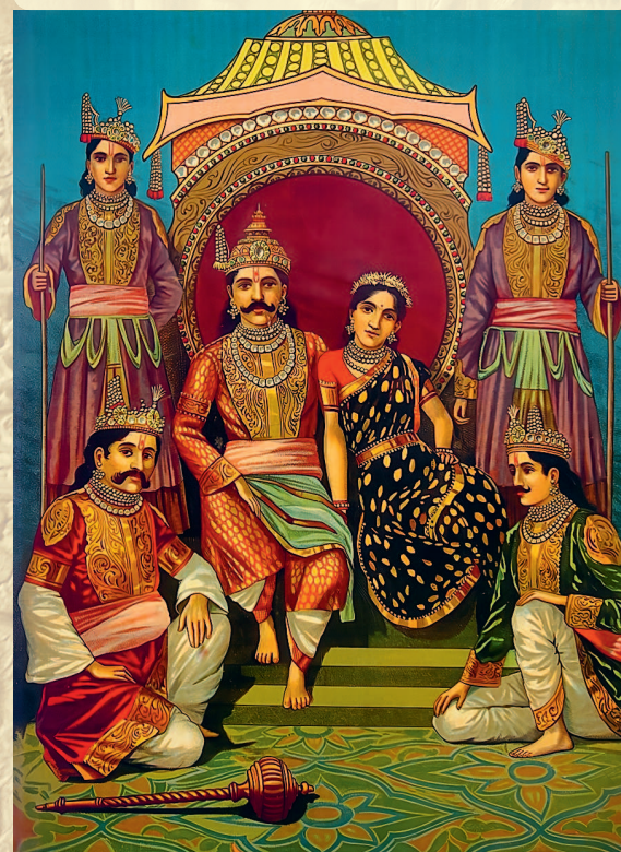
Пятеро братьев Пандавов и их жена Драупади

Отшельники — люди, которые ради религиозных убеждений отказывались жить среди других людей и селились в лесу, в горах или в пустыне. Место, которое они выбирали для жизни и молитв, называлось обителью.