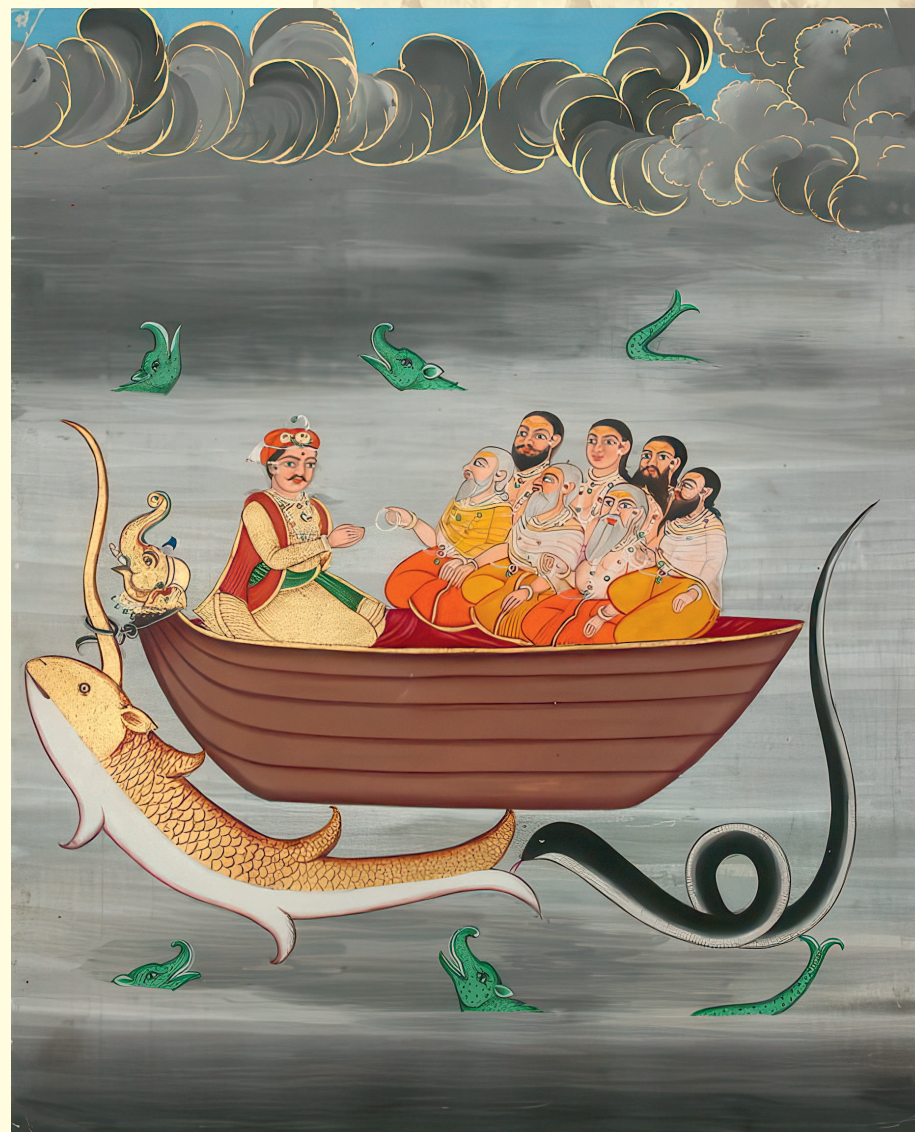
Ману и семь мудрецов

Глубоко в пучину океана нырнула рыба, а после, вынырнув на поверхность, обратилась она к Ману с такими словами: «О спаситель мой! Столько сил отдал ты, помогая мне! Обещала я отплатить тебе добром за добро. Прими же мой совет, выслушай внимательно и поступи, как я тебе скажу! Пройдет немного времени, случится великое бедствие: разверзнутся небеса, хлынет на землю дождь, какого еще не бывало. Из-за того разразится великий потоп. Погубит он на этой земле все живое, скроют воды его все неживое. Но ты, спаситель мой, не погибнешь, если послушаешь моего совета. Наруби деревьев, построй большую лодку, привяжи к ней крепкую веревку. После же погрузи на борт лодки этой по паре всех живых существ, семена всех растений, а также семерых святых мудрецов. Войди в лодку сам и жди меня. Появлюсь я из вод, привяжешь ты лодку веревкой к рогу на моей голове. Понесу я лодку по волнам к великим горам и так спасу тебя от неминуемой гибели!»