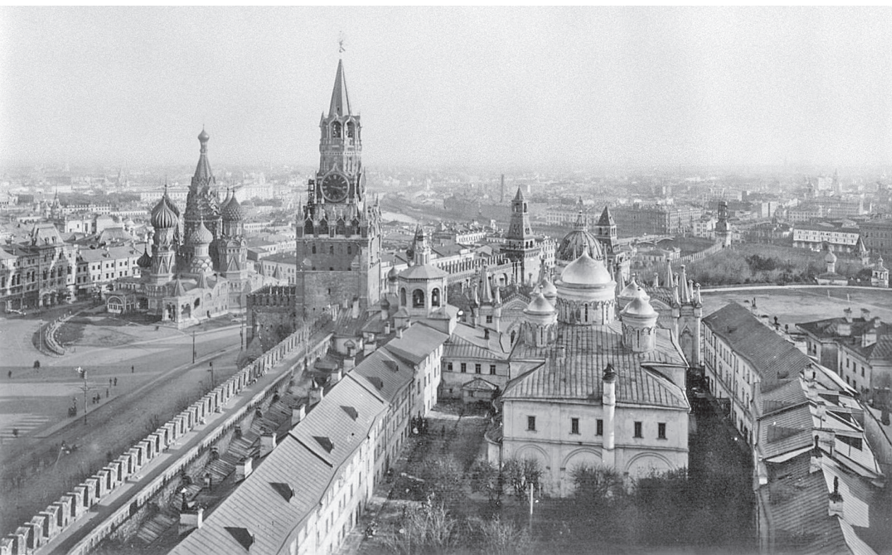
Вознесенский монастырь. Фото конца XIX века

Вдова Дмитрия великая княгиня Евдокия создала новый княгинин некрополь в кремлевском Вознесенском монастыре. Именно Евдокия, в монашестве Евфросиния, — первая видимая женщина Москвы. По существу, она открывает женскую тему в столице. Открывает, что прекрасно, собственной святостью.