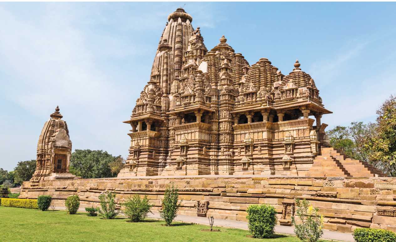
Храм Вишванатха, Кхаджурахо, Индия. Построен между 990 и 1002 годами н. э., в настоящее время является объектом всемирного наследия ЮНЕСКО, храм посвящен индуистскому божеству Шиве и украшен многочисленными символическими скульптурами и гравировками

зуют специальную рентгенографическую технологию для предметного изучения более ранних состояний картины или, возможно, используют химический анализ для определения сложного состава ее красок. При изучении настенной пещерной живописи каменного века искусствоведы применяют технику радиоуглеродного датирования. На стенах пещер Шове во Франции находится древнейшая роспись, созданная примерно в 28–30 тыс. до н.э. Недавно, горельеф, изваянный Альберто Джакометти на надгробии отца — изображения птицы, кубка, солнца и звезды, — был расшифрован специалистом-египтологом из Бруклинского музея, сравнившим их с иероглифом, который читается как «все люди поклоняются солнцу». Новейшие технологии регулярно разоблачают подделки или подтверждают ценность дорогостоящих предметов искусства, а архивные изыскания раз за разом помогают установить новые факты, даты и контекст возникновения произведений искусства.