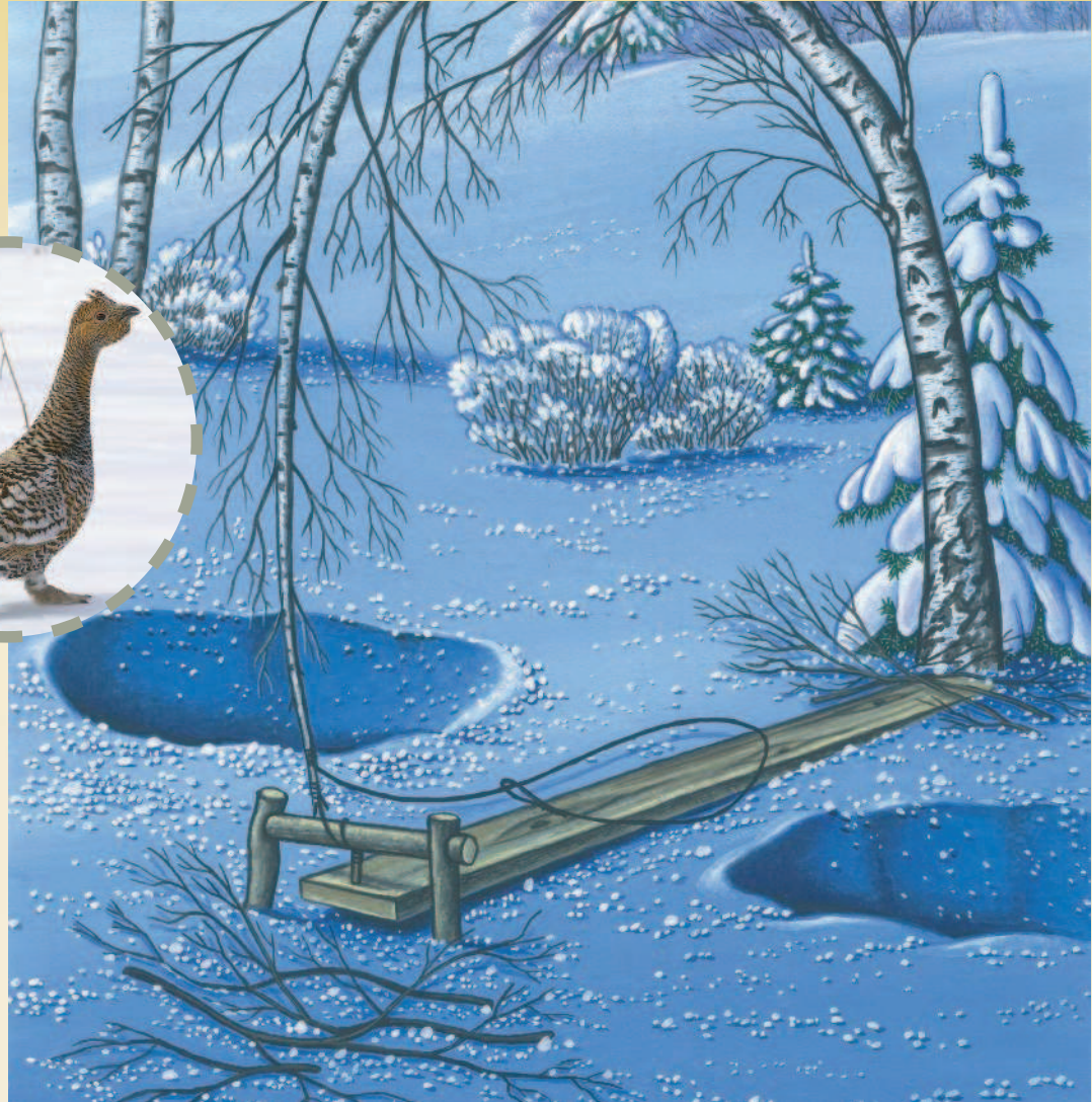
Один из вариантов пужка на глухаря.

сидя на его макушке, а порой располагается посередине или даже на нижних ветвях. Песня-токование состоит из шелканья, похожего на шелканье ружейного курка, и точения, скирканья —