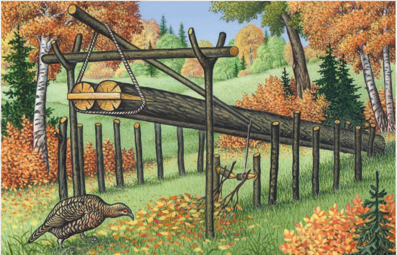
Слопец — ловушка на глухаря.