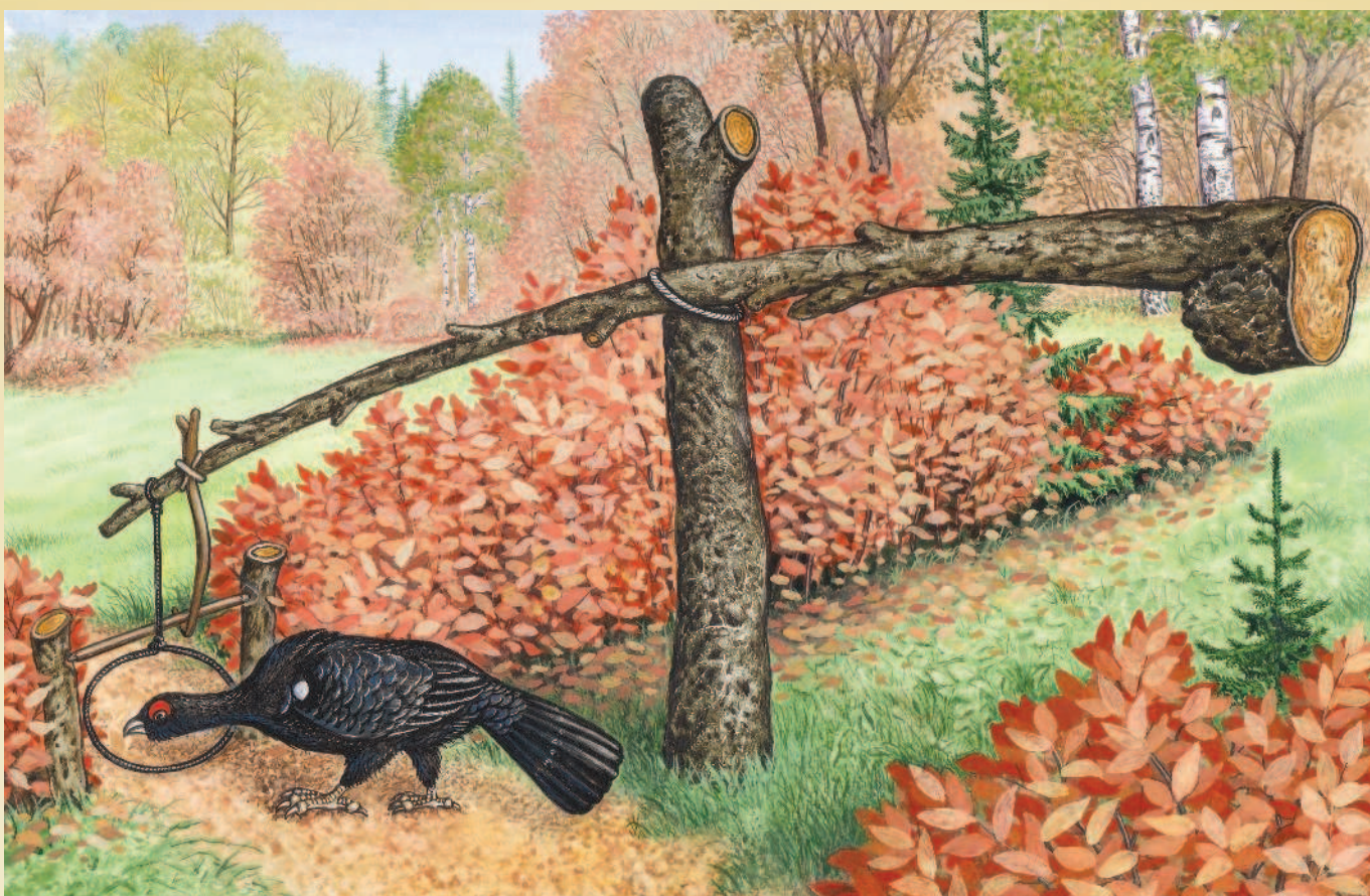
На глухаря охотятся с помощью самоловов. На иллюстрации изображен один из них — так называемая настороженная петля.

не особенно высоко. А лающая очень громко и часто, тем более скачущая на дерево, считается никуда не годной. Найдя глухаря, собака начинает лаять; глухарь сосредоточивает на ней все свое внимание, опускает вниз голову и текает, как будто сердится и дразнит пса. Охотнику нетрудно подойти к птице так, что он может убить ее из винтовки. В случае промаха можно спокойно зарядить ружье снова: молодой глухарь не боится выстрела, и порой удается, если стреляют в непуганую птицу, сделать десять и более выстрелов. Пролетит пуля близко над ее головой — она ложится как бы оглушенная на сук, и по ней можно стрелять несколько раз. Иногда после выстрела глухарь бежит по сучку, перескакивает на другой и, только когда увидит охотника или услышит слишком подозрительный шум, перемещается на другое дерево, но недалеко. Отметим, что глухарка очень недолго выдерживает лай собаки, а потому на лиственнице, как и на осинах, обычно убивают только самцов.