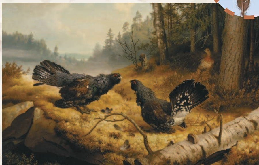
«Бьющиеся глухарь». Картина Ф. фон Райта.