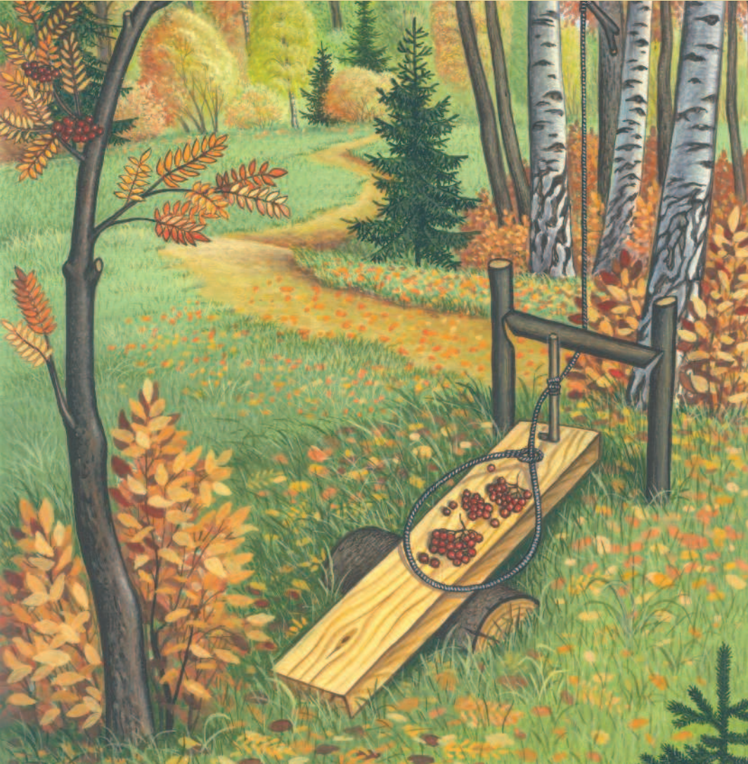
Пружок на глухаря.

инам токовища. В тех случаях, когда на току убивают всех старых глухарей (чего никогда не следует делать), молодые собираются к центру токовища и спариваются с самками. Но не все годовалые глухары становятся половозрелыми