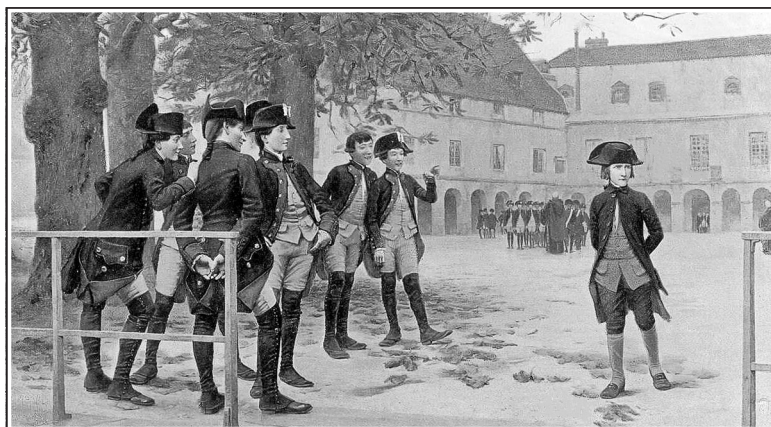
Наполеон Бонапарт в кадетской школе в Бриенн-ле-Шато в 1779 году. Иллюстрация к книге У.-М. Слоана «Жизнь Наполеона Бонапарта». 1896 г.

выговору. Но несколько драк, яростно и не без успеха (хотя и не без повреждений) проведенных маленьким Бонапартом, убедили товарищей в небезопасности подобных столкновений. Учился он превосходно, прекрасно изучил историю Греции и Рима. Он увлекался также математикой и географией. Учителя этой провинциальной военной школы сами не очень были сильны в преподаваемых ими науках, и маленький Наполеон пополнял свои познания чтением. Читал он и в этот ранний период и впоследствии всегда очень много и очень быстро. Французских товарищей удивлял и отчуждал от него его корсиканский патриотизм: для него французы были тогда еще чуждой расой, пришельцами-завоевателями родного острова. Со своей далекой родиной, впрочем, он в эти годы общался только через письма родных: не такие были у семьи средства, чтобы выписывать его на каникулы домой.