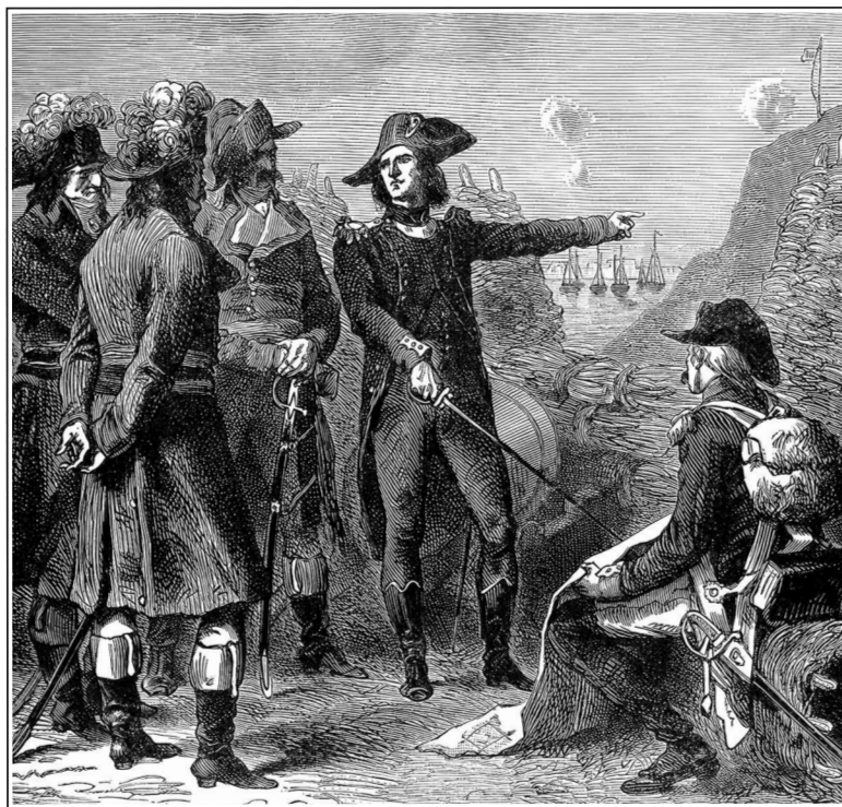
Наполеон излагает план взятия Тулона.

Иллюстрация Ф. Ликса из «Универсальной истории Ридпата». 1897 г.