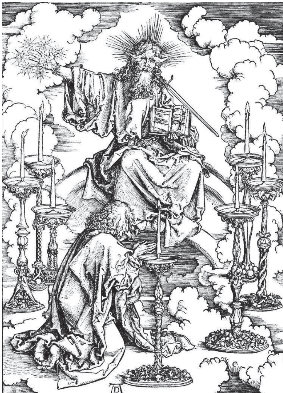
А. ДЮРЕР. Семь светильников. Видение св. Иоанна