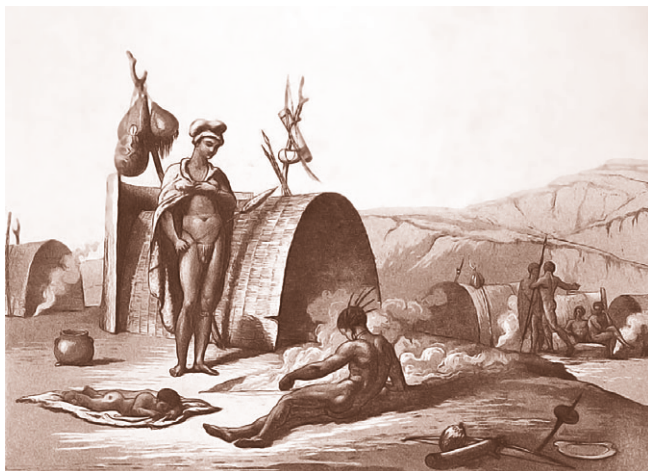
Семья бушменов. Южная Африка

миссионер не может полностью отказаться» * . Таким образом, некоторые африканские языки были сфабрикованы и адаптированы колонизаторами для своих нужд.