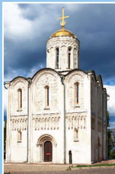
■ Дмитриевский собор словно выточен из цельного камня

Самый изысканный храм Владимира — Дмитриевский собор. Построенный несколькими годами позже Успенского, он как будто выточен из одного огромного камня, поэтому здание кажется цельным. Фасад Дмитриевского собора можно читать как книгу: здесь персонажи-люди умело сочетаются с персонажами-растениями и символизируют цветущее древо жизни.