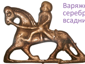
Варяжская серебряная фигурка всадника. X в.