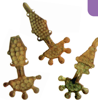
Бронзовые фибулы VI–VII вв., найденные на территории расселения вятичей

После смерти братьев пришли в Киев хазары и потребовали платить им дань. Поляне вынесли хазарам с каждого двора по мечу. Вернувшись домой, показали хазарские послы своему владыке дань полян, и сказали тогда мудрецы хазарские: «Недоброе сулит нам эта дань. Мы воюем саблями, острыми лишь с одной стороны, а эти мечи с двух сторон остры. Как бы не случилось так, что не мы с них дань брать будем, а они — с нас, да и с других народов».