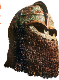
Варяжский шлем. VI–VII вв.

Славяне пригласили варягов править, опираясь на уже сформированную славянскую знать, получив сильных союзников, совместно с которыми могли решить важную задачу — установление контроля над всем торговым путём «из варяг в греки».