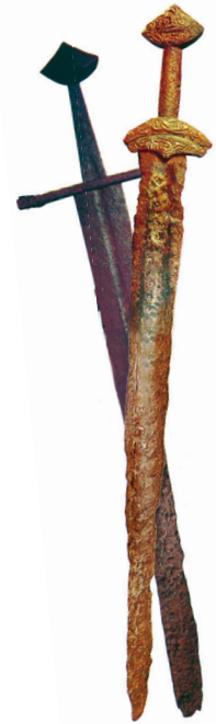
Древнерусские мечи. X–XIII вв.

Расширяя свои владения, хазары разгромили булгар , живших в степях нынешнего Краснодарского края. Часть булгар двинулась на Балканы . Покорив южных славян, булгары дали им своё название — болгары — и основали царство Великую Болгарию . Другая часть булгар ушла на среднюю Волгу, образовав там в X в. государство Волжскую Булгарию , которая приняла ислам от мощного южного соседа — Багдадского халифата.