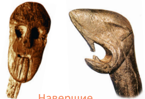
Навершие новгородской ладьи. X в.