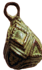
Привеска-бубенчик из Волжской Булгарии. X в.