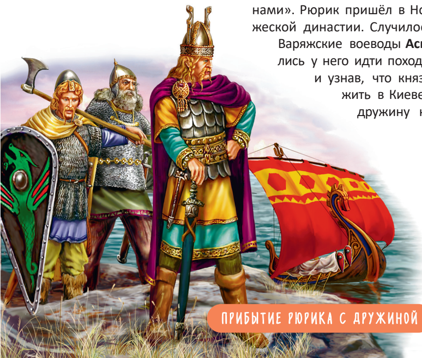
ПРИБИТИЕ РЮРИКА С ДРУЖИНОЙ

Варяжские воеводы Аскольд и Дир из свиты Рюрика отпросились у него идти походом на Царьград . Добравшись до Киева и узнав, что князей там нет, Аскольд и Дир стали княжить в Киеве. Аскольд и Дир, пополнив варяжскую дружину киевлянами, двинулись на 200 ладьях