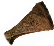
Варяжский топор. X в. Инкрустация серебром