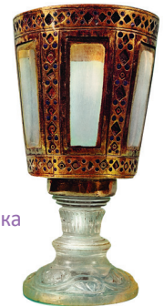
Византийская чаша. X в.