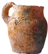
Хазарский керамический сосуд