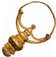
Височное кольцо из клада под Смоленском. X — начало XI в.

Древнерусский «град» (город) — это огороженное поселение с крепостью в центре города — кремлём . Внутри крепости жила знать, купцы, ремесленники, вокруг города росли посады , поселения земледельцев, которые кормили город, обрабатывая окрестные поля. Разросшиеся посады обносили новым кольцом укреплений — так, кольцо за кольцом и росли древнерусские города.