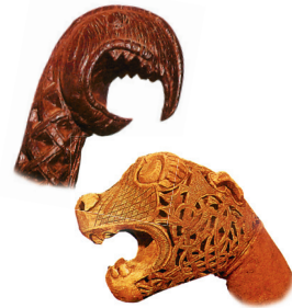
Головы мифических животных с носов варяжских ладей