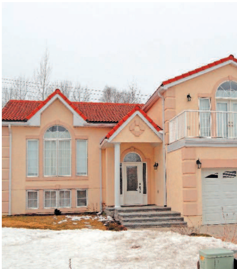
Современный деревянно-каркасный дом, крытый настоящей черепицей, неосновательным никак не назовешь

Противники каркасных конструкций указывают на их недолговечность, непрочность – на какую-то неосновательность в общем.