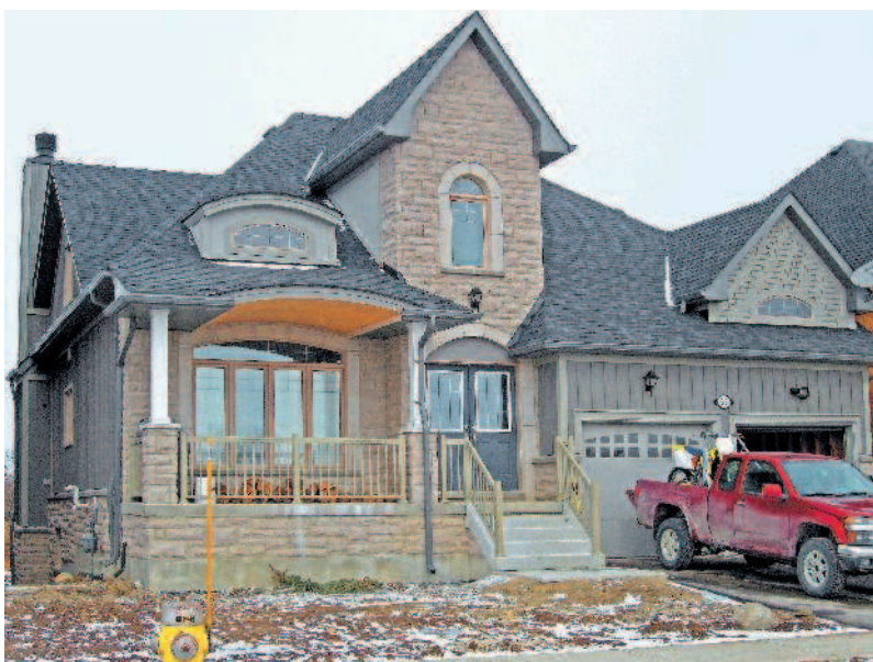
Не все работы завершены