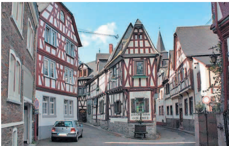
Старинные дома каркасной конструкции типа фахверк

Пример фахверков убеждает, что каркасные дома могут быть очень долговечными.