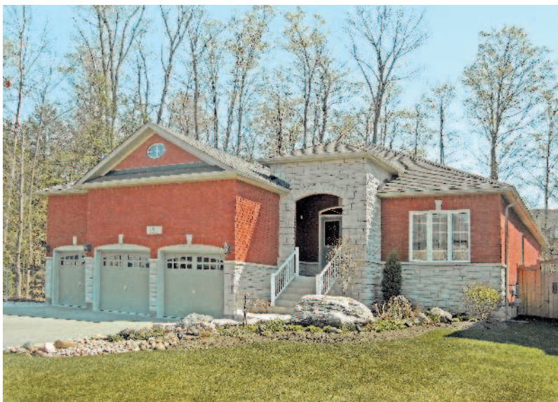
Современный канадский каркасный дом