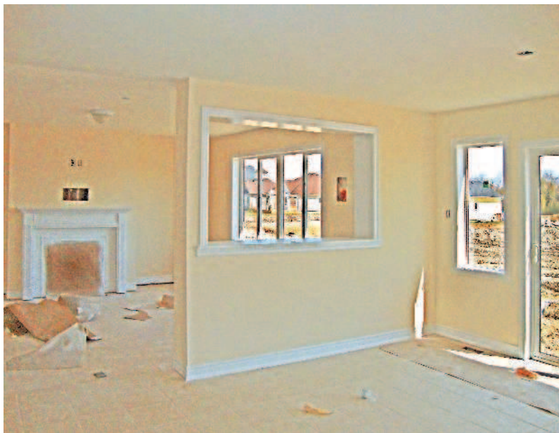
Внутренняя обшивка каркасной стены готова под чистовую отделку

Каркасный дом практически не подвержен усадке, его можно обшивать сразу после возведения каркаса. Обычно внутренняя обшивка каркасного дома выполняется готовыми к отделке цементно-стружечными плитами (ЦСП), гипсокартонными листами (ГКЛ) либо гипсоволокнистыми листами (ГВЛ).