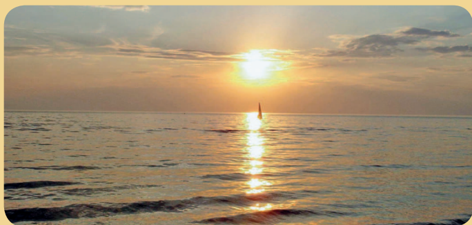
■ Белая ночь над Белым морем