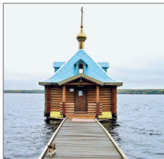
■ Купальня Важеозерского мужского монастыря