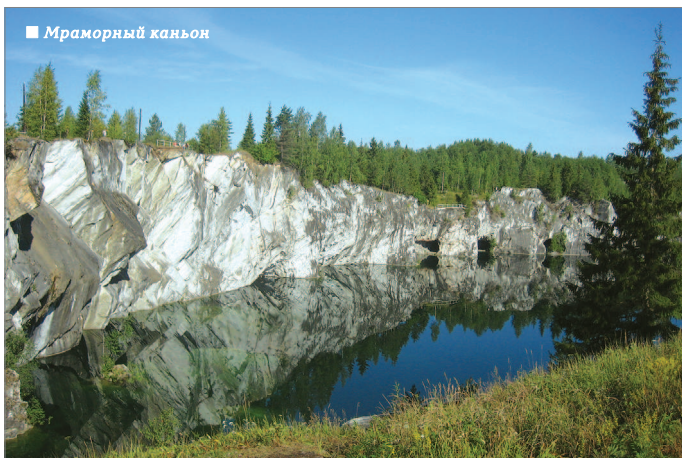
■ Мраморный каньон