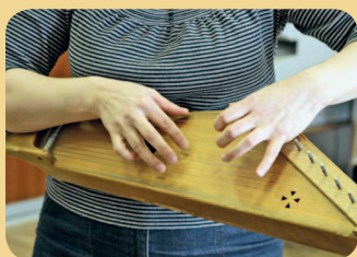
■ Так выглядит кантеле

Посетите «Дом кантеле» в Петро- заводске. Карельский язык сейчас нечасто можно услышать на улице, поэтому сюда стоит сходить на концерт ансамбля песни и пляски «Кантеле». Во время выступления вы услышите игру на таких редких инструментах, как кантеле, варган, йоухикко, сигудек, вирсиканнель, талхарпу, пярэ, шаманские бубны, а также песни на северных диалектах русского языка, карельском, вепском и финском языках. В местном магазине можно купить кантеле – старинный карельский музыкальный инструмент, напоминающий русские гусли.