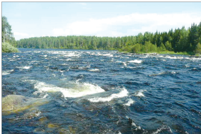
■ Бурная река

ставляет около 640 тыс. жителей, а Швейцарии – 8 млн человек. Почти 40% населения проживает в Петрозаводске. В составе республики – 16 муниципальных районов и 2 городских округа. В Карелии насчитывается более 60 тыс. озер и 27 тыс. рек. Озерно-речная система республики – одна из самых уникальных в мире. Такого соотношения суши и водной поверхности нет больше нигде. В среднем на каждую семью в Карелии, состоящую из трех поколений, приходится одно озеро.