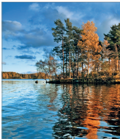
■ Озеро Вуокса