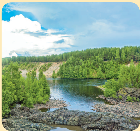
■ Жерло древнего вулкана

Возле поселка находится грандиозный геологический объект – самый древний кратер вулкана в Карелии, возраст которого геологи оценивают в 2,5–3 млрд лет. Возле Пальеозерской ГЭС располагается северная часть кратера вулкана. При строительстве плотины был осушен гигантский водопад, который пробил в горной породе огромный каньон. Вулканические породы, выстилающие дно бывшего водопада, очень напоминают потоки лавы. Когда-то здесь царил кромешный ад, но сейчас застывшие лавовые потоки выглядят не грозно, а очень и очень живописно.