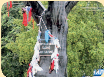
■ Дерево желаний

На Онежской набережной в Петрозаводске раскинуло ветви «Дерево желаний» – подарок шведского города-побратима Умео. Это настоящая сосна, покрытая стеклотканью. На черном стволе прикреплено огромное белое ухо и табличка с надписью «Прошепчи одно желание». Здесь следует задумать желание и потихоньку произнести его в ухо. На ветвях дерева висят колокольчики. Если после того как желание было загадано, колокольчики начинают звенеть, значит, оно сбудется.