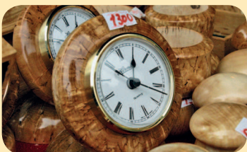
■ Изделия из карельской березы

Это, казалось бы, самое распространенное российское дерево в Карелии обладает уникальными свойствами – золотистым цветом и рисунком, напоминающим мрамор. За твердость и прочность в старину его называли «Царским деревом». Из березы делают вазы, визитницы, зажигалки, блюда, шкатулки, шахматы и авторучки. Владелец такой вещицы может с уверенностью сказать: «Я был в Карелии».