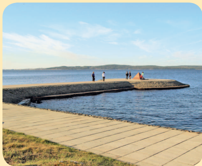
■ Прибрежный парк

Лучшим украшением столицы Карелии является вид на Онежское озеро. Когда выходишь на Онежскую набережную, дух захватывает от синего первозданного простора. Вдоль берега раскинулся Прибрежный парк – самый молодой в городе. Здесь можно вволю налюбоваться водной гладью, послушать крики белоснежных чаек и проводить взглядом катер или «Метеор», оставляющий за собой пенный след. На набережной царит атмосфера отдыха и безмятежности, свойственная южным курортным городам.