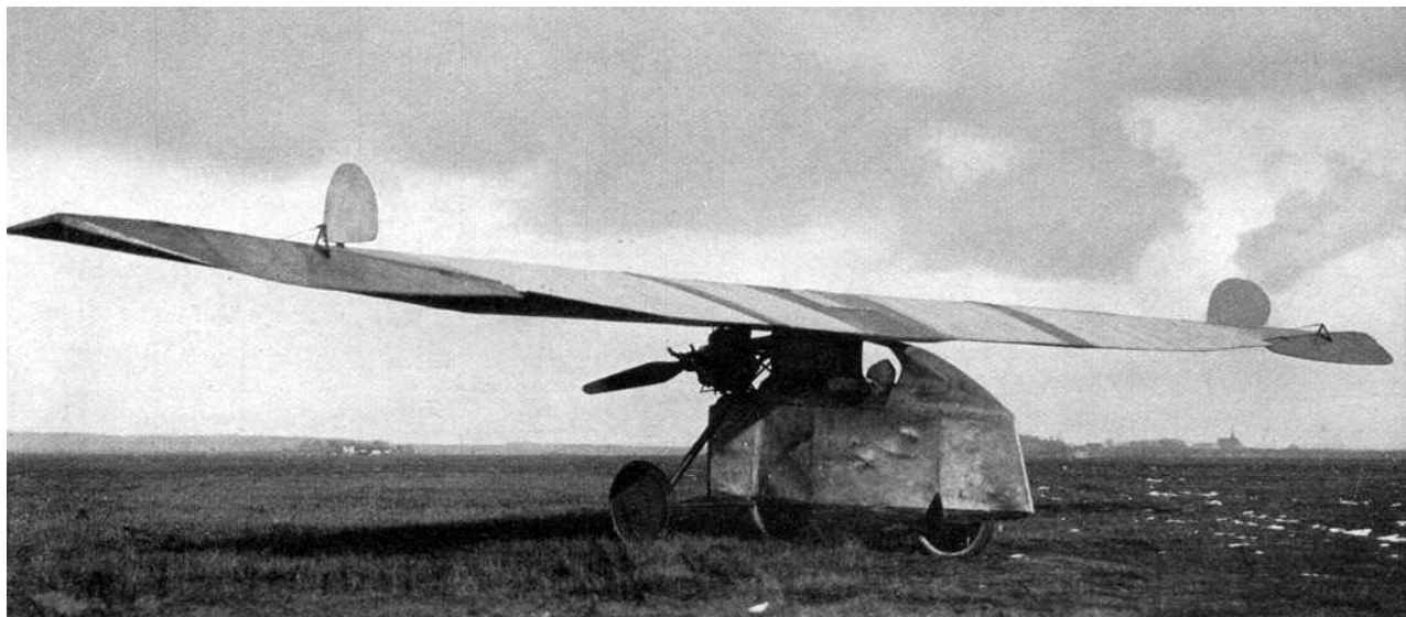
С таких вот летательных аппаратов началось зарождение Люфтваффе!

песчаной косе Курише Нехрунг, расположенной между Балтийским морем и заливом Фриш-Хафф. Вылеты там выполнялись с прибрежных песчаных дюн, имевших высоту от 45 до 60 метров. В 1921 году студенты Дармштадтского технического университета создали Академическую авиационную группу (Akademische fliegergruppe — сокр. Akaflieg), которая должна была играть ведущую роль в развитии немецкого планеризма.