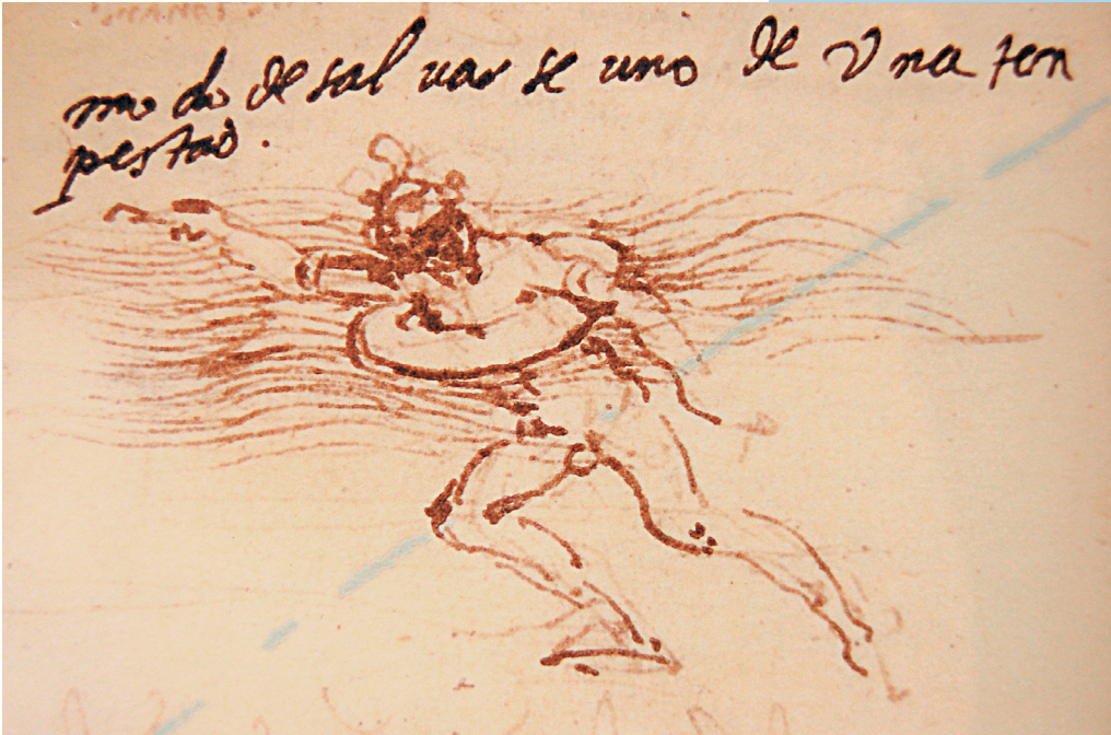
Набросок спасательного круга

к сыну. Известно, что Леонардо был левшой, писал справа налево, начиная с последней страницы, то есть так, как это было принято на Востоке. Скорее всего, именно от матери ему передались навыки правописания и чтения.