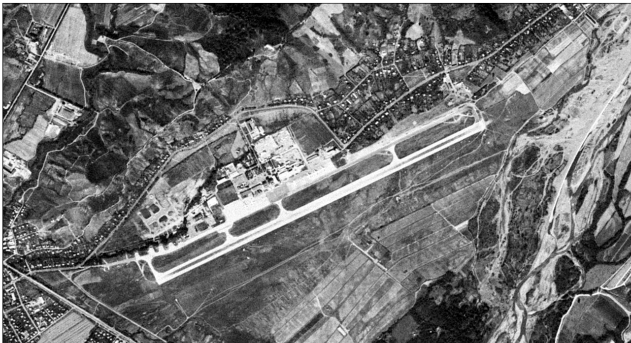
Фото района аэропорта Адлер 1965 года