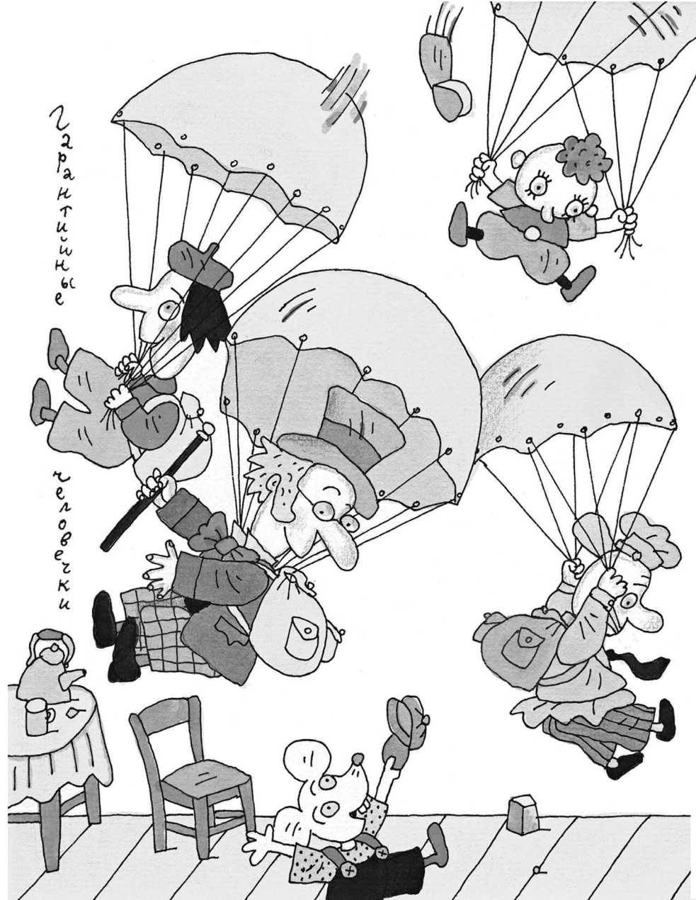
Рисунки В. Дмитриюка