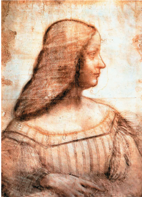
Портрет Изабеллы д'Эсте, герцогини Мантуанской, Леонардо да Винчи, 1499 г.

либо оживляли цветными бликами отдельные детали: глаза, губы, уши, одежду.