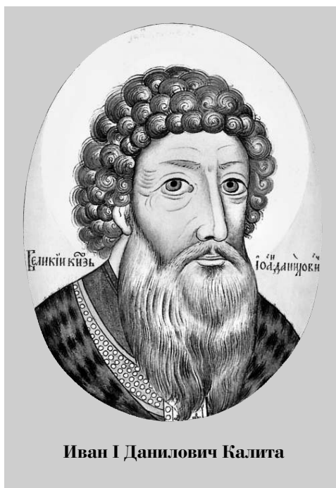
Иван I Данилович Калита