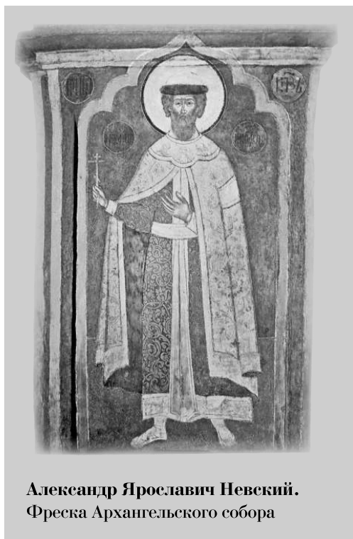
Александр Ярославич Невский. Фреска Архангельского собора

Важное значение имело географическое положение Москвы. Следствием монголо-татарского нашествия и усилившегося натиска Литвы стало то, что основная масса русского населения оказалась