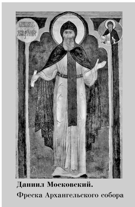
Даниил Московский. Фреска Архангельского собора

Обратившись к карте города XIV в., легко заметить, что практически с момента своего основания Москва оказалась окруженной плотным кольцом пригородных сел. К востоку от древнего московского посада, тесно примыкая к нему, располагалось село Кулишки (в районе современной Славянской площади) — вероятно, одно из тех «сел красных» вокруг Москвы, владение которыми предание приписывает еще полупрозрачному боярину Кучке. На юге территорию города долгое время естественным обра-