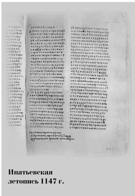
Ипатьевская летопись 1147 г.

Внимание исследователей истории двух российских столиц пока еще обращено, главным образом, на их историю как собственно городов. Значительно меньше изучено формирование этих городов как все-российских промышленных, торговых, финансовых, культурных и научных центров, их взаимовлияние со своей округой, страной, зарубежными государствами, остальным миром.