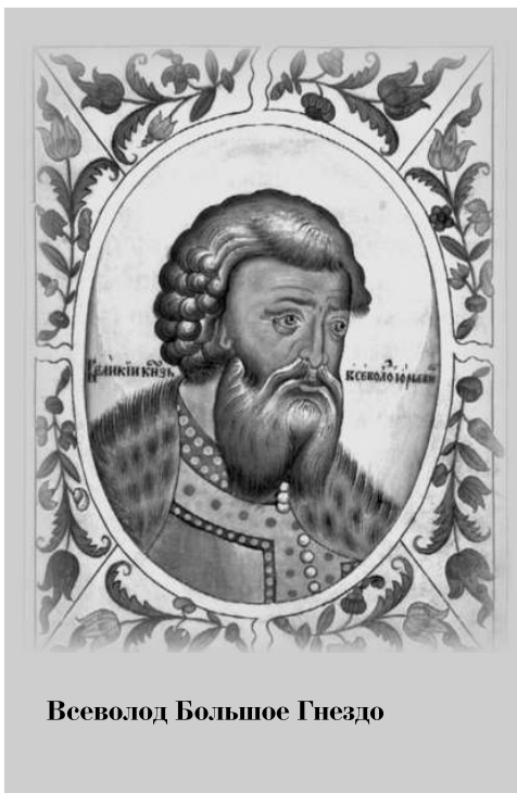
Всеволод Большое Гнездо

представляется то, что еще во второй половине XII в. Москва имела и второе название — Кучково. Описывая события этого времени, летописец записал: «Идоша с нимь до Кучкова рекше до Москвы». Интересно отметить, что это же название — Кучково — встречается и в одной из новгородских берестяных грамот, найденной во время археологических раскопок в Новгороде в 1991 г. и относящейся к тому же XII столетию. Таким образом, «села красные» боярина Кучки — это историческая реальность.