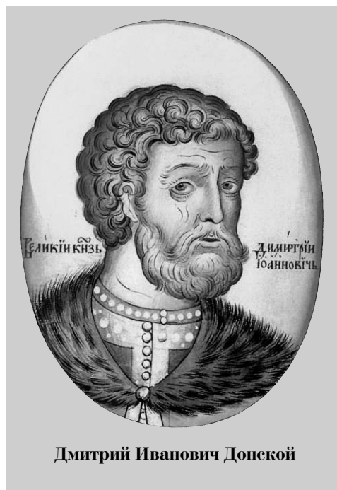
Дмитрий Иванович Донской

зом ограничивала Москва-река. За нею лежали села Хвостовское (в районе современных Хвостовых переулков), когда-то принадлежавшее боярину XIV столетия Алексею Петровичу Хвосту, и Кадашево, память о котором сохранилась до сих пор в названиях Кадашевской набережной и переулков. К западу от Кремля, в районе Остоженки, находилось село Семчинское, одно из древнейших подмосковных сел, упоминаемое еще в завещании Ивана Калиты. По соседству с ним, в районе нынешней Российской государственной библиотеки, стояло село Старое Ваганьково, место которого и сейчас легко определить по небольшой церкви, стоящей в библиотечном дворе, позади знаменитого Дома Пашкова. Эти топографические указания довольно точно очерчивают пределы московского посада рубежа XIV—XV вв. Долгое время городская черта не пересекала этих границ.