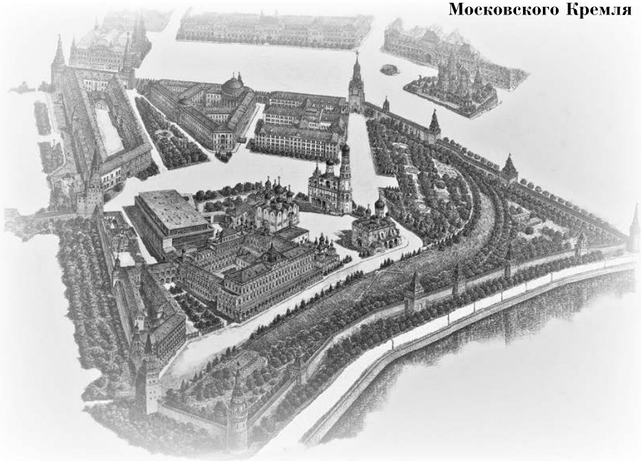
Современный план Московского Кремля

К сожалению, необходимо констатировать, что в современной исторической науке эта проблема только лишь начинает разрабатываться. Это хорошо видно на примере знакомства с литературой, посвященной истории двух крупнейших мегаполисов России, население которых еще в начале XX в. превысило двухмиллионную отметку: Москвы и Петербурга.