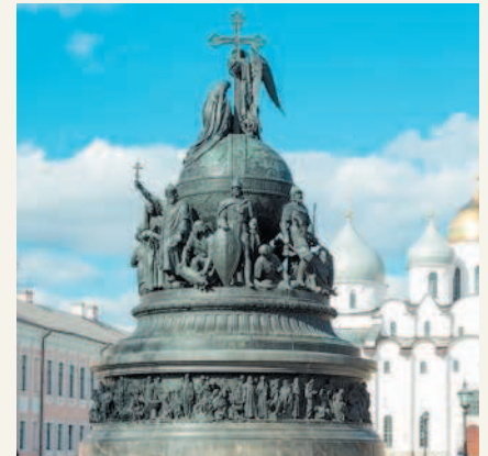
Памятник «Тысячелетие России» Великий Новгород. Кремль

Примечания. 1. Названия областей, одноименные с их центрами, на карте не подписаны. 2. Граница между Республикой Ингушетия и Чеченской Республикой на карте не показана. В соответствии с Законом Российской Федерации «Об образовании Ингушской Республики в составе Российской Федерации от 4 июня 1992 г. для подготовки правовых и организационных мероприятий по государственному-территориальному разграничению установлен переходный период.