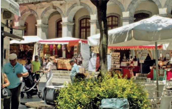
■ Воскресная ярмарка в Браге

Путеводитель по Португалии подробно рассказывает о самых интересных достопримечательностях страны, которые расположены в пяти его важнейших городах – Лисабоне, Порту, Коимбре, Браге и Эворе. Специально разработанные маршруты помогают сориентироваться во времени и пространстве. Тематическая прогулка «Шпионский Лиссабон» погружает в мир секретных агентов Второй мировой войны. Инструкции о том, как само-