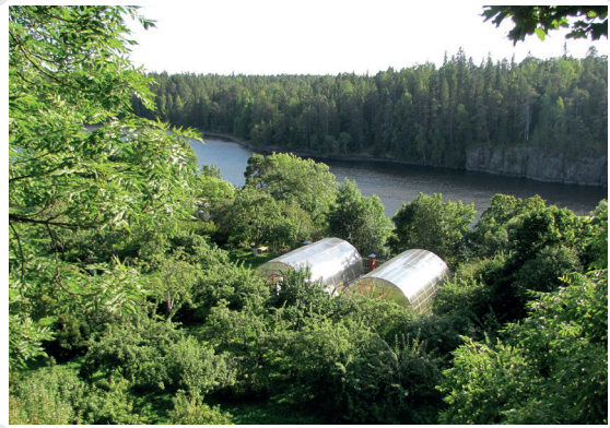
Парники на Валааме