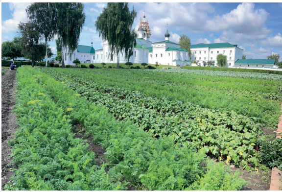
Спасо-Преображенский монастырь в Муроме