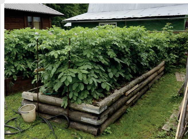
Современные грядки по типу средневековых грядок