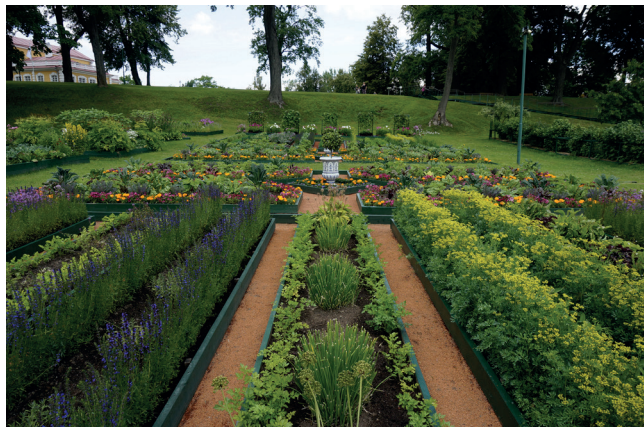
↑ Вид с нижней террасы огорода

Путешествуя по Западной Европе, Петр I обратил внимание на то, что в Голландии, которая произвела на него самое приятное впечатление, овощи, пряно-вкусовые и лекарственные растения, посаженные на одной грядке перед домами, создают эффект цветника и радуют глаз не меньше, чем цветочная клумба, а при должном уходе еще и дают хороший урожай. Эту моду, которая получила название «Огород на голландский вкус», он привнес на территорию Санкт-Петербурга.