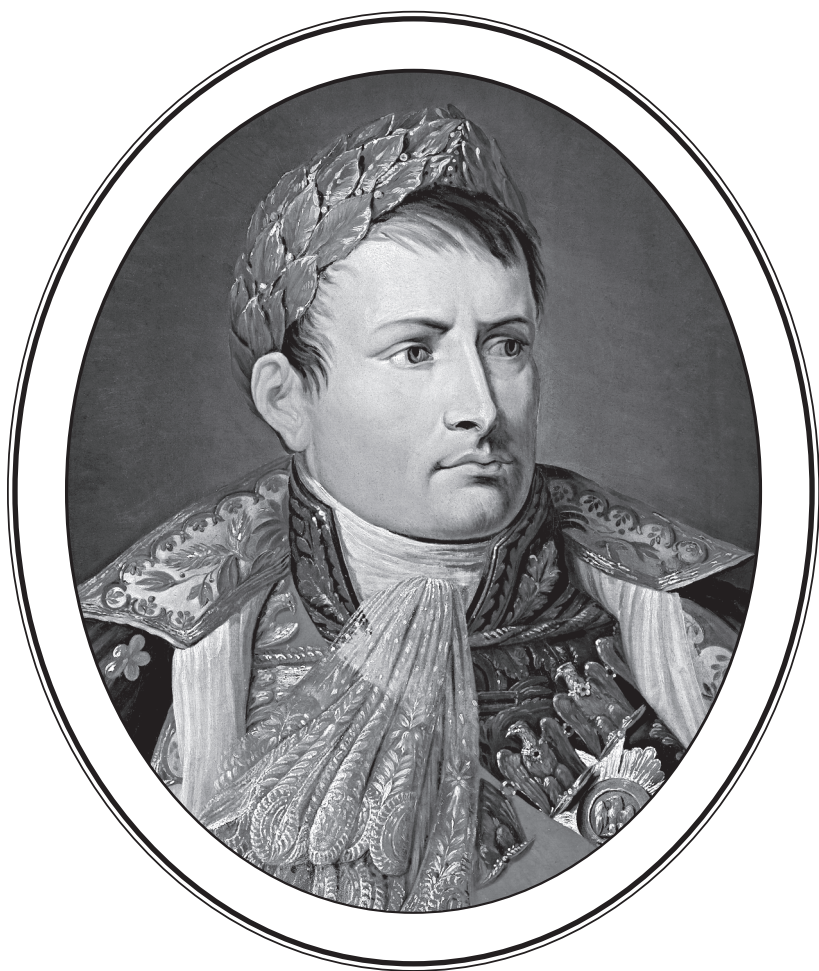
Наполеон Бонапарт (1769—1821)