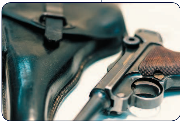
Пистолет Р-08 «Парабеллум»

Несмотря на то что в начале Второй мировой войны Р-08 уже начали заменять на более эффективный пистолет Р-38, «Парабеллум» практически до самого конца войны оставался основным оружием офицеров вермахта.