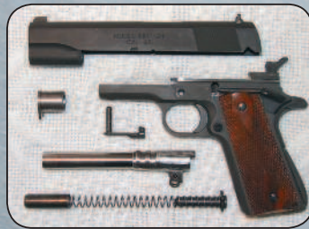
Основные детали (неполная разборка) пистолета M1911.

Пистолет M1911 состоял из трех крупных частей (рамки, ствола и кожуха-затвора) и 53 более мелких деталей. Автоматика работала за счет отдачи при коротком ходе ствола. Однако в отличие от всех предыдущих моделей ствол M1911 был соединен с рамкой пистолета при помощи только одной (качающейся) серьги, расположенной под казенной частью ствола. После выстрела ствол, сцепленный с затвором, двигался назад. При этом серьга поворачивалась на подствольной оси, и казенная часть ствола опускалась. Ствол останавливался, а затвор, продолжая движение назад, выбрасывал использованную гильзу, взводил курок и сжимал возвратную и боевую пружины. Кстати, конструктор нашел для этих пружин очень удачное месторасположение, разместив возвратную пружину под стволом, а боевую — в рукоятке, позади магазина.