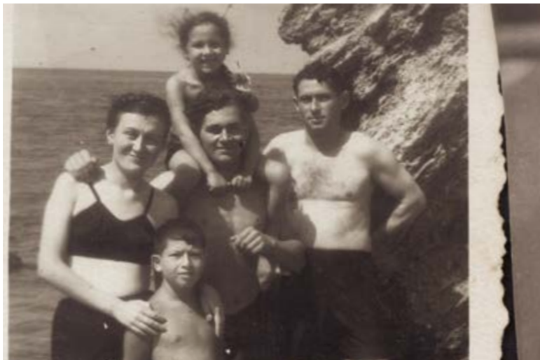
В Одессе на пляже с семьей