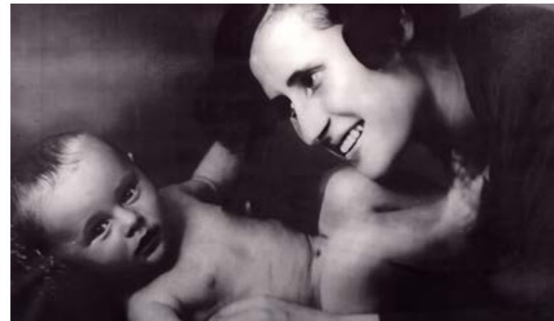
Только что родился. С мамой

Близко познакомиться с Ливнами мне довелось спустя лет сорок. Как-то на первом «жигуленке» поехали с семьей в Батуми. А когда возвращались обратно и проезжали недалеко от Орла, я предложил: «Давайте заглянем в Ливны – туда, где я родился».