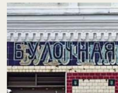
Историческая вывеска «Булочная и кондитерская» на улице Покровка в Москве

И еще Покровка ассоциируется с Новым годом, запахом хвои и свежих мандаринов