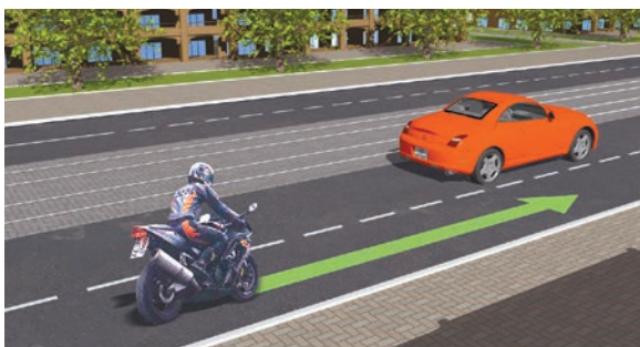
Опережение не подразумевает выезд на соседнюю полосу и может осуществляться и слева и справа

« Опережение » — движение транспортного средства со скоростью, большей скорости попутного транспортного средства.