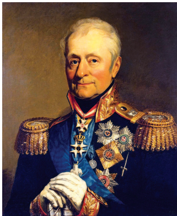
Л.Л. Беннигсен (худ. Дж. Доу)

«Он [Кутузов. — Авт.] решил, так сказать, выполнить план генерала Барклая, но не счел удобным остаться на позиции при Царево-Займище; он искал более сильную позицию, и полковник Толь избрал таковую близ Можайска».