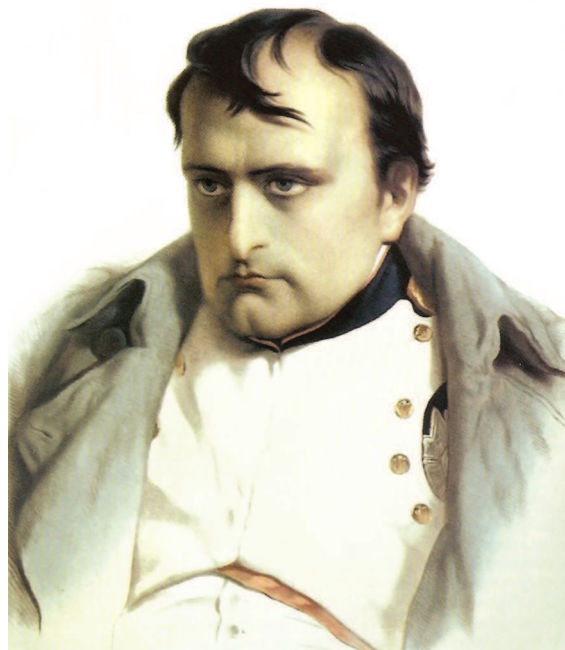
Император Наполеон (худ. Э. Лассаль по оригиналу П. Делароша)

Кстати сказать, промежуточная позиция в 12 километрах от Бородино Кутузову не понравилась, ибо местность изобиловала лесами, мешавшими маневрировать пехоте и кавалерии.