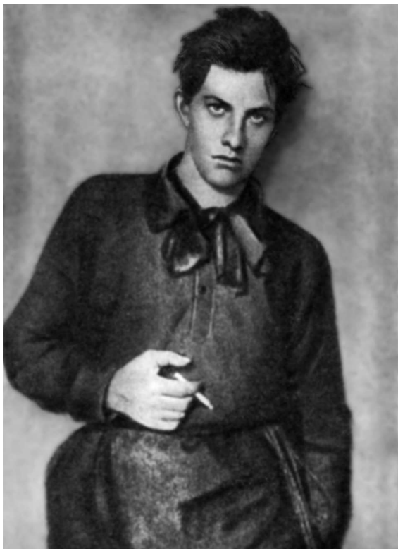
В. Маяковский — ученик Строгановского Училища. Москва, 1910 г.