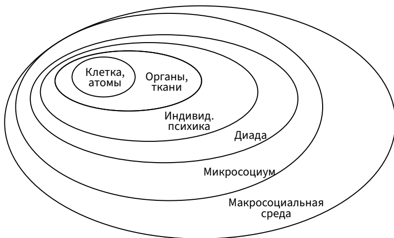
Рис. 1. Уровни детерминации здоровья по Дж. Энджелу

Основы биопсихосоциального подхода в психосоматике были заложены Дж. Энджелом (Engel, 1977) (рис. 1).