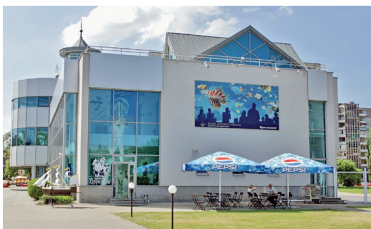
Музей Мирового океана

Ужин. Рекомендуем сходить в ресторан литовской кухни «Брикас» в торгово-развлекательном центре «Европа».