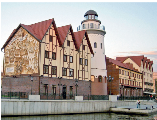
Набережная «Рыбной деревни»