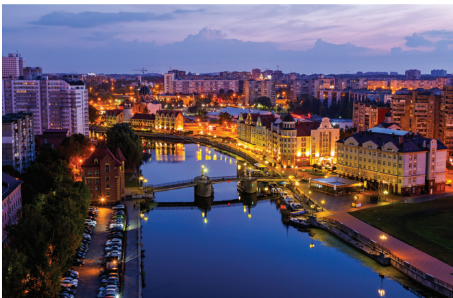
Раннее утро в Калининграде, набережная Рыбной деревни и Юбилейный мост