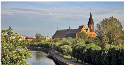
Вид на остров Кнайпхоф и собор