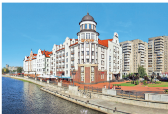
Вид на «Рыбную деревню»

Вечер. Проведите его по собственному усмотрению: сходите на вечерний спектакль в драматический театр, послушайте органннй концерт в кафедральном соборе или отправьтесь в один из модных ночных клубов, например в Nisha на проспекте Мира, 92.