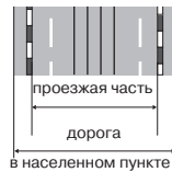
в населенном пункте

« Дорожное движение » — совокупность общественных отношений, возникающих в процессе перемещения людей и грузов с помощью транспортных средств или без таковых в пределах дорог.