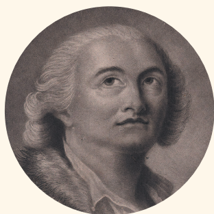
Джузеппе Бальзамо (Калиостро). Гравюра по оригиналу неизвестного автора, XVIII в.

Современники утверждали, что паутина подземных ходов опутывала практически все недра острова и в этих самых катакомбах масоны проводили свои таинственные ритуалы. Калиостро определенное время прожил в доме Ивана Елагина и чувствовал себя там вполне привольно: вроде как даже совершил несколько исцелений, воскресил парочку умерших младенцев и обратил некоторое количество булыжников в золото. Елагин принимал во всем этом весьма деятельное участие — он был страстным поклонником всего загадочного, таинственного и мистического. «Граф» намекал также на то, что он может создавать буквально из ничего драгоценные камни, демонстрируя всем желающим крупные бриллианты, рубины и изумруды и уверяя, что они собственного производства.