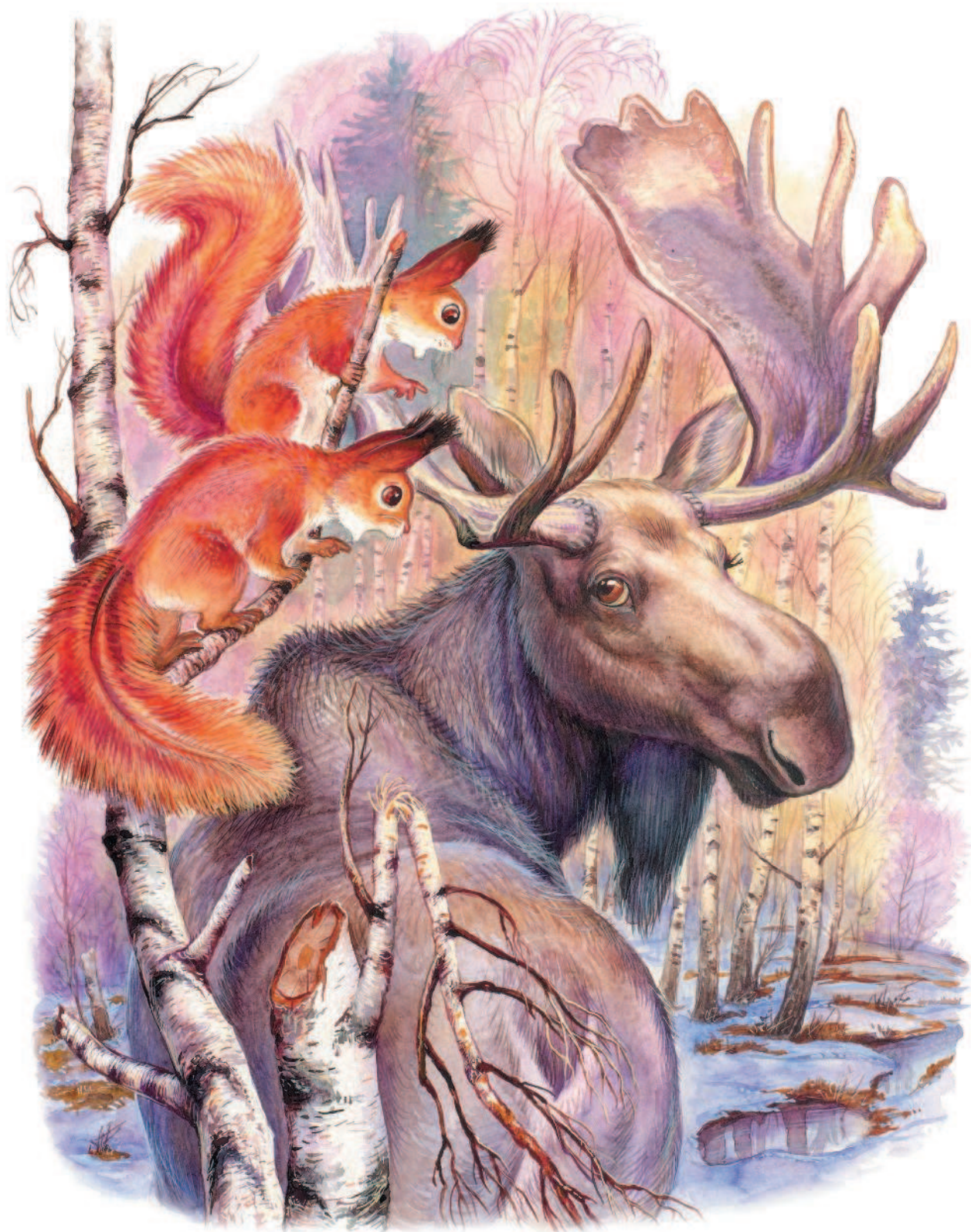
Рисунки И. Цыганкова