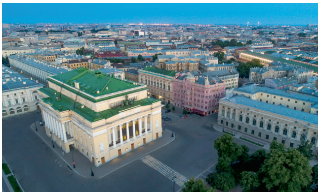
В Санкт-Петербурге параллельно развиваются традиции классики и музыкального авангарда. На фото — Александринский театр с высоты птичьего полета