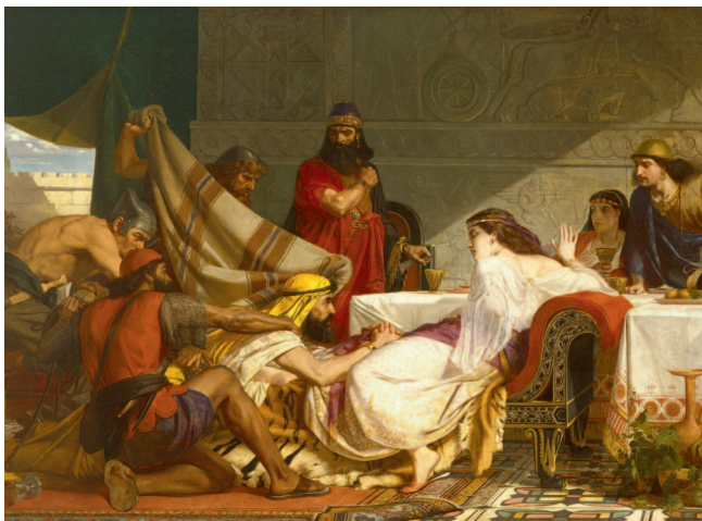
«Артаксерсово действо» было поставлено по библейской «Книге Есфири». Здесь представлено произведение художника Э. Армитиджа на эту же тему

Музыку как таковую, конечно, не искоренили, да и народное творчество полностью запретить не удалось; но при дворе начали чаще использовать инструменты европейского происхождения — или просто те, которые не особо запятнали себя участием в скоморошьях представлениях. При царском дворе были популярны органы, скрипки, ударные, флейты, различные трубы.