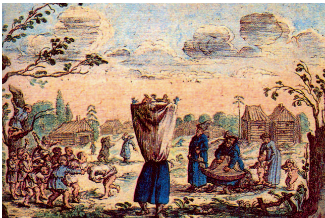
Скоморохи. Гравюра из книги А. Олеария «Описание путешествия в Московию», XVII в.