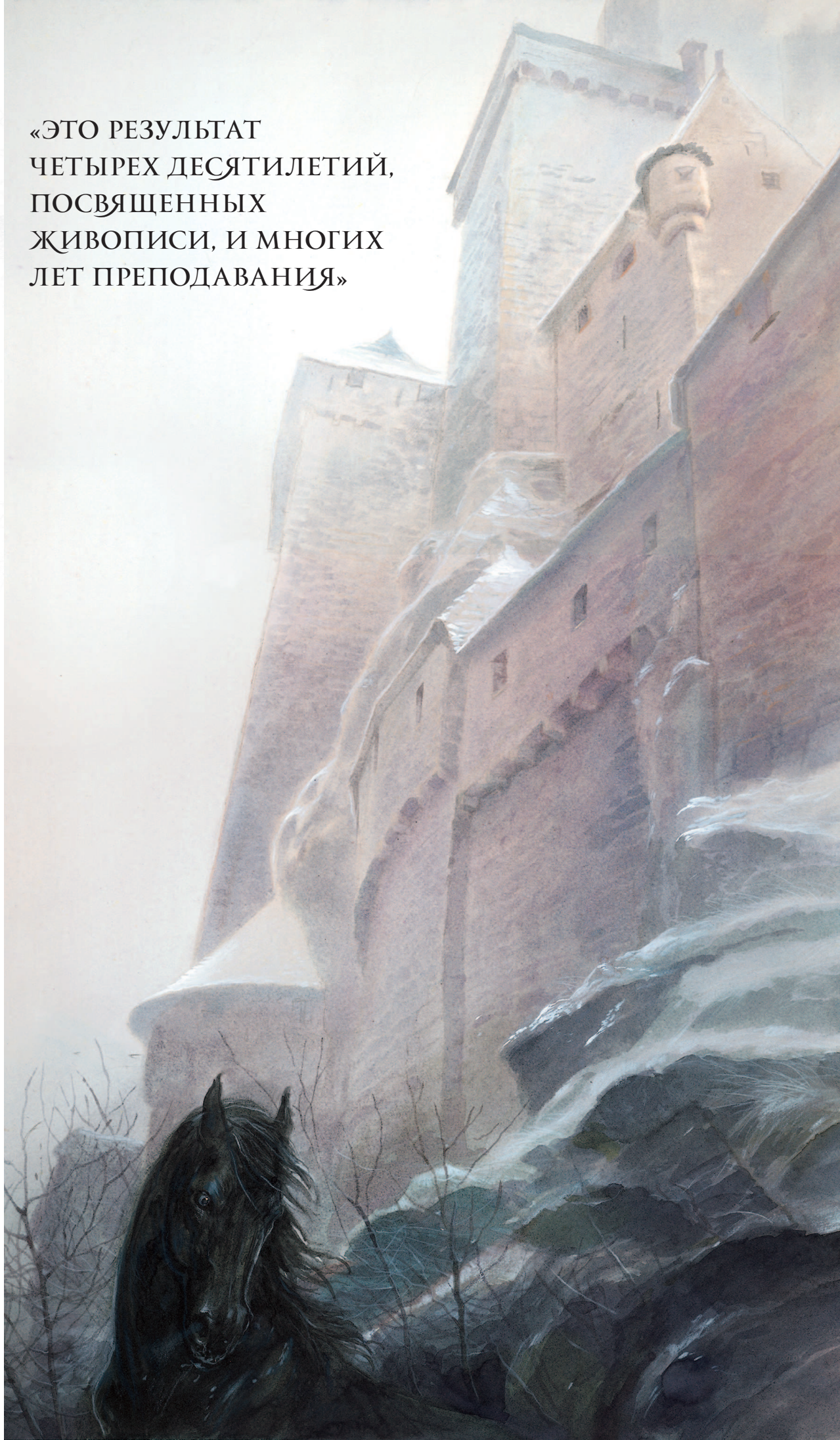
Иллюстрация на задней обложке «Золотого дурака», II тома «Саги о Шуте и Убийце» Робин Хобб. Я очень хорошо знаю этот замок и часто бывал в нем. Возможность бродить и прогуливаться по таким местам — пожалуй, главное, что удерживает меня в Европе.